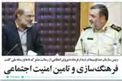
رئیس سازمان صدا و سیما در دیدار فرمانده نیروی انتظامی از رماضات مشترک کاخ و رسانه ملی گفت...