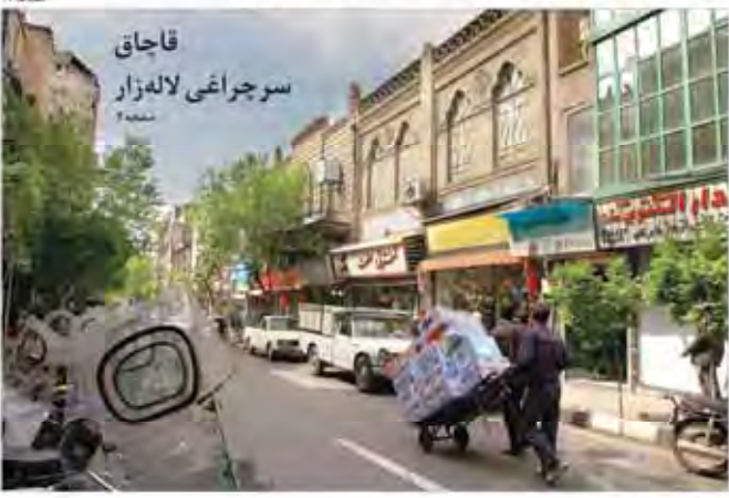
قاجاق سرچراغی لاله زار شماره ۶