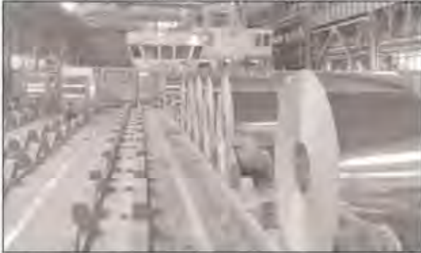
ورجعت ایران من حيث الانتاج في سبتمبر/أيلول، مركزا واحدا للمرتبة ١٤ من بين ٦٦ بلدا ينتج الصلب في العالم.

طهران-فارس:-أكد الاتحاد العالمي للصلب في أحدث تقرير، تسجيل انتاج ایران نموًا بنسبة ١٨٫٨ بالمئة في شهر سبتمبر/أيلول ٢٠١٦ على أساس سنوي. وأوضح التقرير بان انتاج ایران بلغ ١٫٥٨٨ مليون طن في سبتمبر/أيلول ٢٠١٦، مرتفعا ١٨٫٨ بالمئة عن المستوى المسجل في الشهر ذاته العام الماضي والبالغ ١٫٣٧٧ مليون طن. وبحسب تقديرات الاتحاد، فان متوسط انتاج ایران في الشهور التسعة الأولى من عام ٢٠١٦ بلغ ١٣٢١ مليون طن مرتفعا ٨ بالمئة قياسا بالفترة ذاتها العام الماضي، حين بلغ المتوسط ١٢٢٣١ مليون طن. وبلغ الانتاج الاجمالي لإيران في عام ٢٠١٥، مستوى ١٦١ مليون طن.