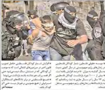
فوتیاسیون در فلسطین. شمار کودکان فلسطینی اسیر شده در سال جاری ۱۰۰۰ نفر برآورد شد.