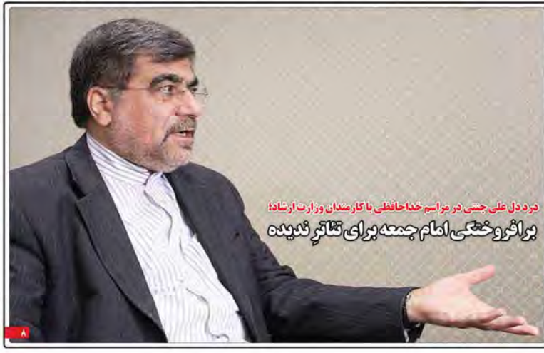
درد دل علی جنتی در مراسم خدا حافظی با کارمندان وزارت ارشاد؛ بر اثر وخشی امام جمعه برای تکلیف ندیده

آسیب‌شناسی فضای سوت و کور شعب بانکها غلامرضا کبایهر این روزها مشاهده فضای سوت و کور شعب بانکها برای مردمی که از مفای آنها می‌گذرند به امری عادی تبدیل شده است. شعبی که بانکها برای رهن و اجاره یا خرید و تجهیز و راهاندازی هر یک از آنها منابع هنگفتی هزینه کرده‌اند و هر ماه نیز منابع هنگفتی را برای نگهداری و پرداخت حقوق و مزایای روسا و کارکنان شعب هزینه می‌کنند. دیدن صحنه سوت و کور