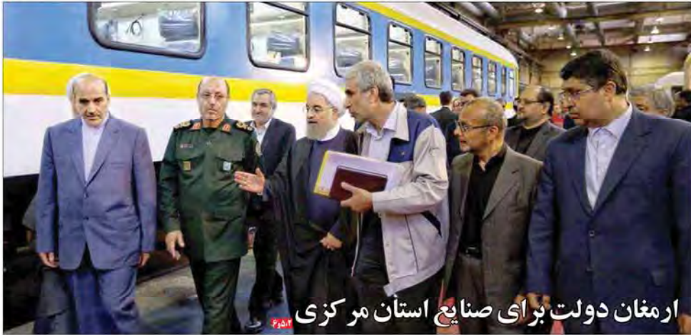
ارمغان دولت برای صنایع استان مرکزی

با ورود به نیمه دوم سال به مرور آثار سیاست‌های دولت در رونق تولید در حال نمایان شدن است. بررسی تورم تولید در شهرستان‌های استان که بخش ساخت(صنعت) پس از ماه‌ها تورم منفی توانسته ترمیمی مثبت را تجربه کند به عیار است. دیگر تورم منفی ۱۶ درصدی بخش صنعت در تیر و منفی ۱۳ درصد در روند در نیمه دوم سال ادامه پیدا کند.