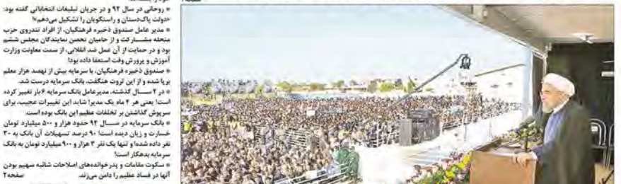
روزی در خمین: کارخانه‌های ما یکی پس از دیگری از رکود خارج می‌شود!

گزارش خبری تحلیلی کیهان: فساد رخ داده در صندوق ذخیره فرهنگیان، در تاریخ ایران بی‌سابقه بوده است. با این حال مدعیان اصلاحات و رسانه‌های زنجیرهای مهر سکوت بر لب زده و بر این غارت بی‌سابقه چشم خود را بستند.