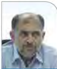
محمد اشته ایچیشه

مناطق ویژه اقتصادی مشوق‌های بسیاری برای جذب سرمایه‌گذاری دارند