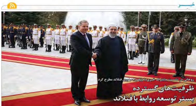
روحانی در نشست مشترک خبری با رئیس‌جمهوری فنلاند مطرح کرد ظرفیت‌های گسترده بستر توسعه روابط با فنلاند