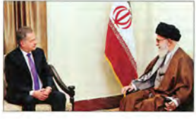
رئیس‌جمهور معظم انقلاب در ۵ دیار رئیس‌جمهور فنلاند

نمایندگان مجلس در نامه‌ای به رئیس‌جمهور خواستار اجرای قانون اصلاح بودجه ۹۵ برای بخشش سود تسهیلات کمتر از ۱۰۰ میلیون تومان شدند