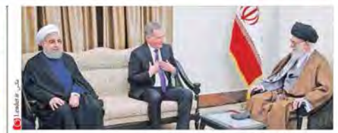
رئیس‌جمهور معظم انقلاب اسلامی در دیدار رئیس‌جمهوری فنلاند

بازش غافلگیر کننده، مدارس را تعطیل و بخشی راه‌های ارتباطی را تشدید کرد