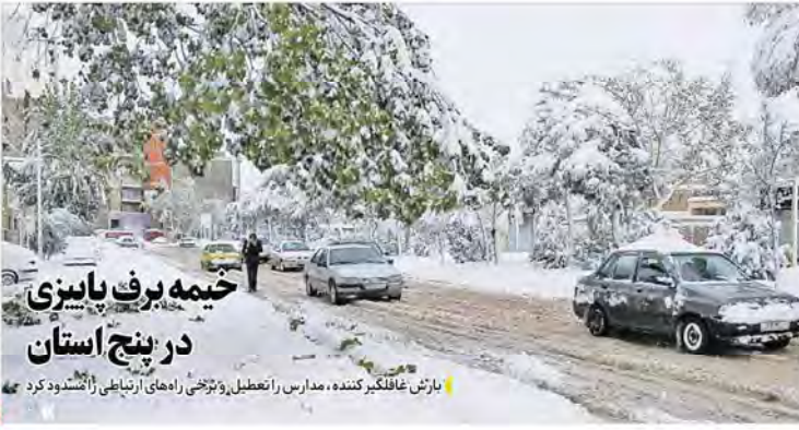
خیمه برف بایزی در پنج استان

آغاز طرح از دو ماه آینده / نرخ بهره یا نرخ تورم بنگران است / پیش پرداخت و مدت زمان پرداخت اقساط به صورت توافقی بین خریدار با انبوه ساز / در واحدهای مسکونی پیش فروش، مشاوران املاک حق دخالت ندارند و این امر تنها در دفترخانه‌ها انجام می‌شود