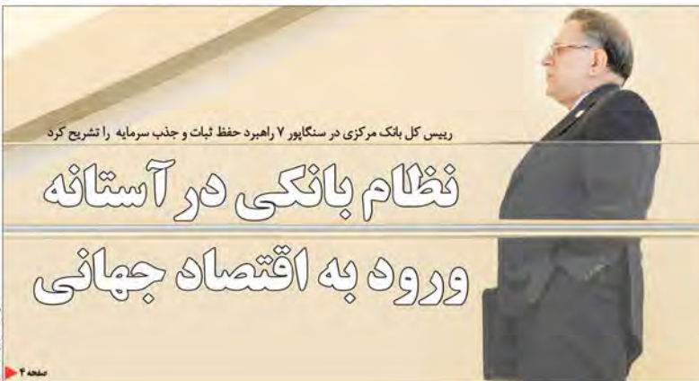
رئیس کل بانک مرکزی در سنگاپور ۷ راهبرد حفظ ثبات و جذب سرمایه را تشریح کرد

نظام بانکی در آستانه ورود به اقتصاد جهانی