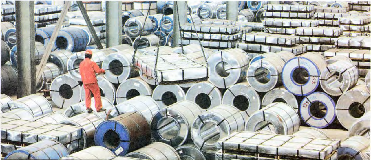
Chinese steelmakers have been aggressively dumping their products into the global markets at highly cheap prices and gradually taking over the market share of other producers.

by the Chinese government and supported through low-interest loans and incentives, Chinese steelmakers have been aggressively dumping their products into the global markets at significantly cheap prices, disturbing the steel markets' balance and gradually taking over the market share of other producers.