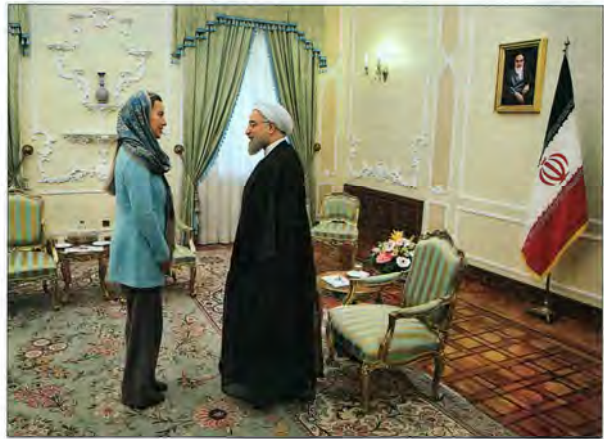
نگاه اروپا به تهران برای حل بحران سوریه مسئول سیاست خارجی اتحادیه اروپا بعد از مذاکره با ظریف و روحانی به عربستان رفت

امروز در خانه پیمانید آلودگی هوای تهران به روز سوم رسید