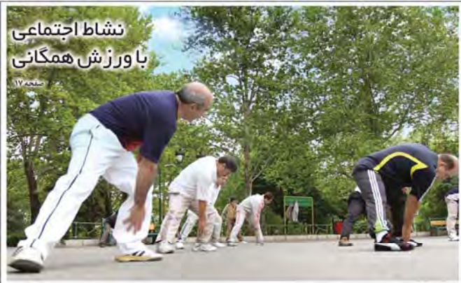
نشاط اجتماعی با ورزش همگانی