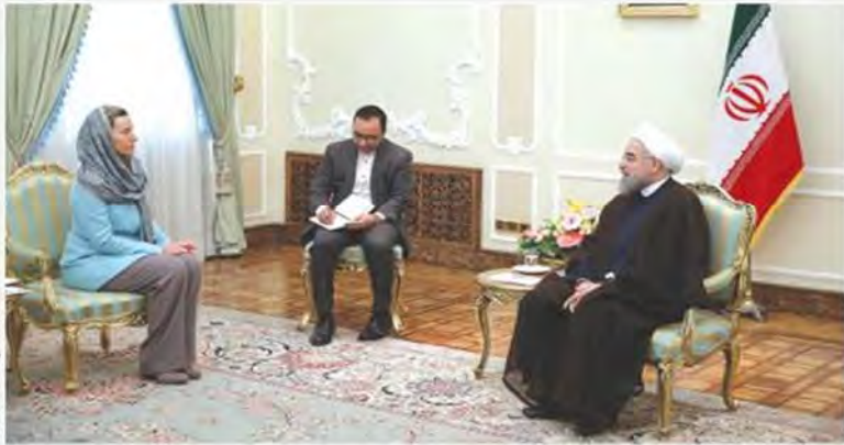
ملاقات مگر بنی با رئیس جمهور و وزیر خارجه