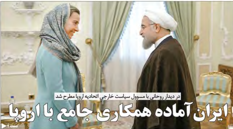
در دیدار روحانی با مسوول سیاست خارجی اتحادیه اروپا مطرح شد