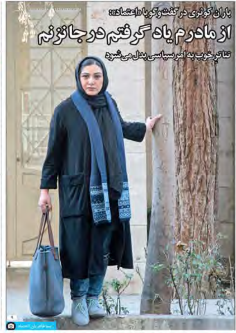
باران کوشی در گفتگو با «اعتقاد» از مادرم یاد گرفتم هر چقدر هم تاکت خوب به اکثر سیاسی بپردازم