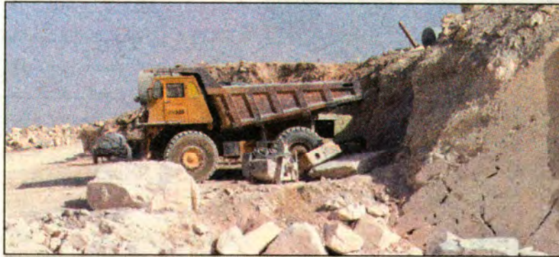
۴۵۰ معدن در کل استان آذربایجان غربی فعال هستند