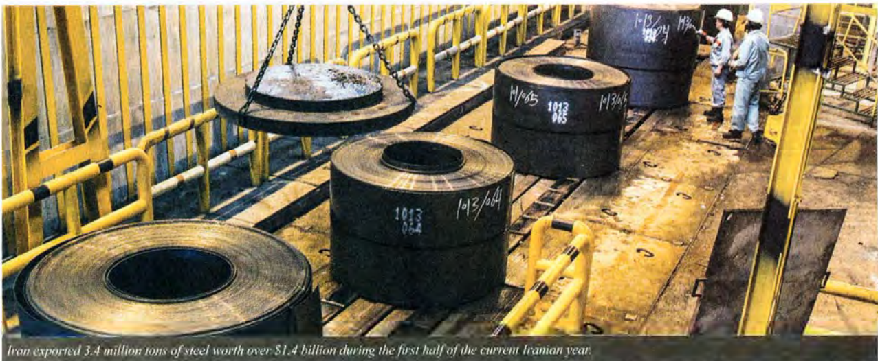
Iran exported 3.4 million tons of steel worth over $1.4 billion during the first half of the current Iranian year.