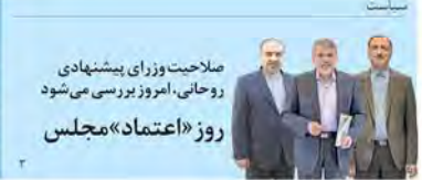
صلاحت وزیر پیشنهادی روحانی، امروز بررسی می شود روز «اعتقاد» مجلس

وزیر اطلاعات: یک مورد «دو تابعیتی» هم سراغ ندارد گزارش میدانی «اعتقاد» مقابل سازمان برنام هزینه تاخیر هر ماه یک میلیارد تومان معاون مسکن و شهرسازی در گفتگو با «اعتقاد» یک سال است بدون تخصیص بودجه کار می کنیم لایحه ها چه نقشی در انتخابات امریکا بازی می کنند؟ یادداشتی از فرید میجرانی تحلیلی درباره رویس هرانی در امریکا