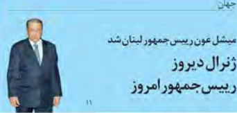
میشل عون رئیس جمهور لبنان شد ژنرال دیروز رئیس جمهور امروز

مجله هفتگی شماره ۱۰۰۰ تیراژ: ۳۰۰۰ سال انتشار: ۱۳۹۵ قیمت: ۱۰۰۰ تومان