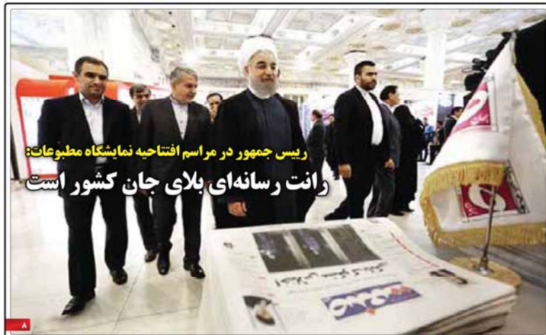
رئیس جمهوری در مراسم افتتاحیه نمایشگاه مطبوعات؛ رانت رسانه‌های بالای جان کشور است