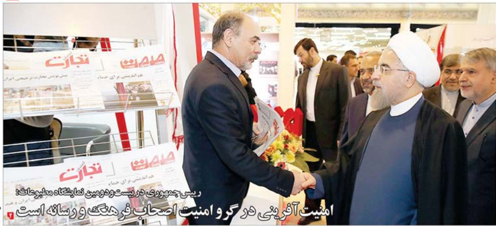
رئیس جمهوری در بیست و دومین نمایشگاه مطبوعات؛ امنیت آفرینی در گرو امنیت اصحاب فریبگی و رساناه است

در فضای مناسبی که امروز به وجود آمده و شاهد حضور هیات‌های خارجی در کشور هستیم فرصت خوبی است که شرکت‌های مهندسی به صورت مشارکتی، پهنه‌های معدنی به افرادی که دارای توان فنی و مالی هستند خبر داد و گفت: کسانی که پهنه‌های معدنی در اختیار دارند، در ادامه از واگذاری مشارکت کنند یا پهنه‌ها را به افراد دارای صلاحیت واگذار کنند.