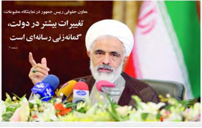
معاون حقوقی رئیس جمهور در نمايشگاه معلومات: تغییرات بیشتر در دولت، گمانه‌زنی رسانه‌ای است