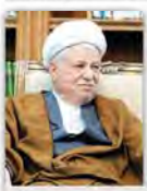
آیت‌الله‌هاشمی‌رفسنجانی رئیس مجمع تشخیص مصلحت نظام: