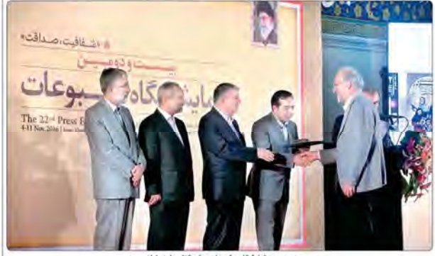
بیست و دومین نمایشگاه مطبوعات و خبرگزاری‌ها به پایان رسید

نهادندان: وظیفه دولت، حراست از آزادی بیان است ۱۰ «مؤکریستی بر تعهد اتحادیه اروپا در اجرای کامل برجام تأکید کرد» ۱۱ «انتخابات ترامپ مسئولیت اروپا را افزایش می‌دهد» ۱۲ «برجام در قطعنامه‌های شورای امنیت سازمان ملل گنجانده شده است» ۱۳ «موضع اروپا مستقل از تحولات در امر برجام تعیین می‌شود» ۱۴ «طریف در دیدار با وزیر خارجه چک» همه طرف‌های برجام باید به آن وفادار باشند ۱۵ «برجام به درد همه می‌خورد اما به این معنا نیست که ایران گزینه دیگری نداشته باشد» ۱۶ «چنگوی استانبول ایران می‌خواهد به برجام متعهد بماند و این به نفع همگان است» ۱۷ «ما به طور کامل به تعهدات خود در برجام عمل کرده‌ایم» ۱۸ «مهران سوری به نظر راه‌حل سیاسی دارد و امیدواریم برخی کشورها هم به این فکر برسند» ۱۹ «وزیر خارجه جمهوری آذربایجان: با برجام بی‌سابقه است» ۲۰ «اسدالله و چاک نورو: برجام بسیار است» ۲۱ «نورمحمد: چک، ضمانت تعهد» ۲۲ «مستر آ: همکاری با طرف» ۲۳ «مهران: دولت خود با تلاش مشترک با» ۲۴ «مهران: چک خود با تلاش مشترک با» ۲۵ «مهران: چک خود با تلاش مشترک با»