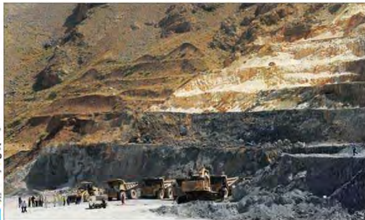
سهمیه سهیلی از دست امروز

ورود مدیران ارشد وزارت صنعت، معدن و تجارت برای حل این موضوع تنها راه حل این موضوع است و به نظر من هیچ راه حل دیگری وجود ندارد. باتوجه به اینکه تمامی معادن در این استان، مصالح ساختمانی است، مهم است و نمی توان به راحتی از آن چشم پوشی کرد.