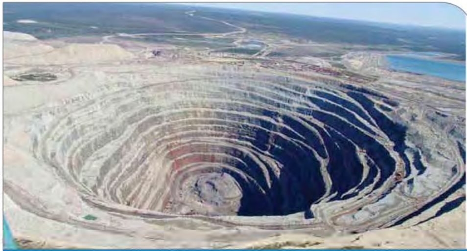
کرمان، باغ شاهرزاده ماهان

آسیب‌رساندن به محیط‌زیست و پایین بودن بهره‌وری آنها هیچ سودی به‌دست نیامده است. این امر باعث شده تعدادی از معادن که از اعتبار بالایی در زمینه فرآوری سنگ‌آهن برخوردار بودند نیز از اعتبارشان کاسته شود.