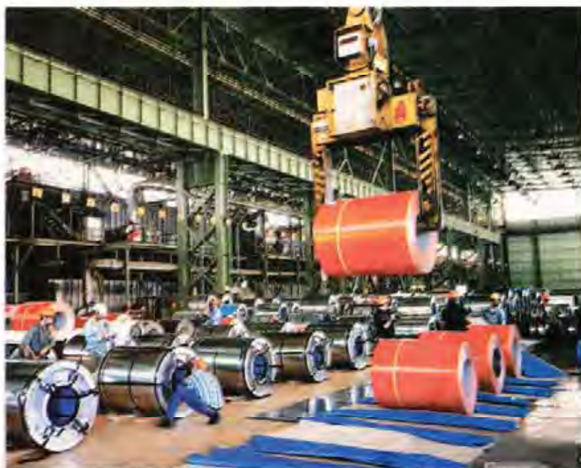
MSC is Middle East and North Africa's largest flat steel producer and Iran's largest steelmaker

Together with its subsidiaries, MSC is the largest flat steel producer in the Middle East and North Africa region and Iran's largest