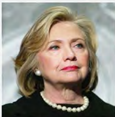
کلیتوت در جستجوی دلایل شکست نفرین ایمیل‌ها