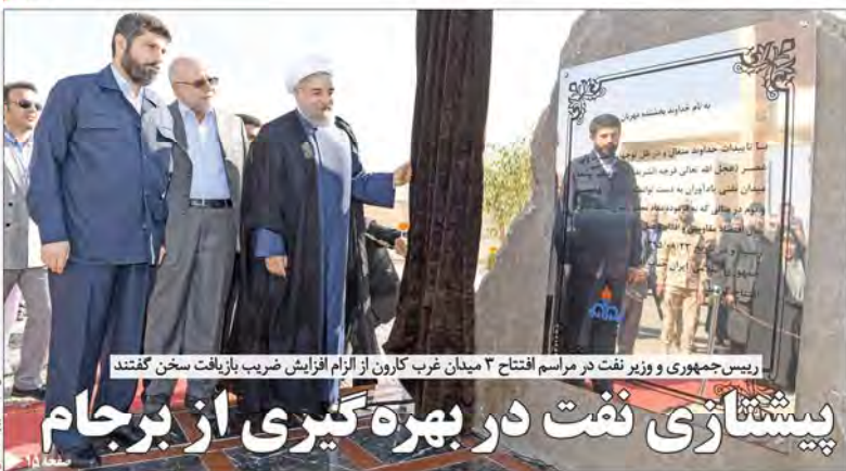
رئیس‌جمهوری و وزیر نفت در مراسم افتتاح ۳ میدان غرب کارون از الزام افزایش ضریب بازیافت سخن گفتند پیشنشازی نفت در بهره‌گیری از برجام