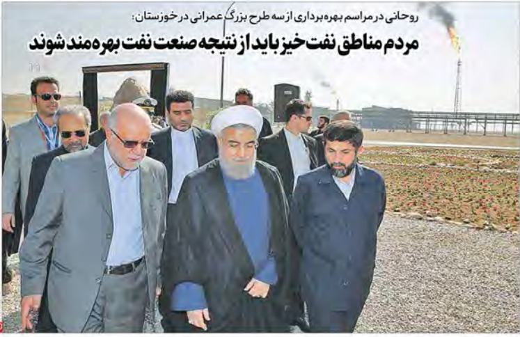
روحانی در مراسم بهره‌برداری از سه طرح بزرگ عمرانی در خوزستان: مردم مناطق نفت خیز باید از نتیجه صنعت نفت بهره‌مند شوند ورود زائران به عراق ادامه دار و روان است سفر یک میلیون زائر ایرانی اربعین به کربلا واکنش خیاباری به ناگامی انتخاباتی: «آفتابی آی» عامل شکست من بود