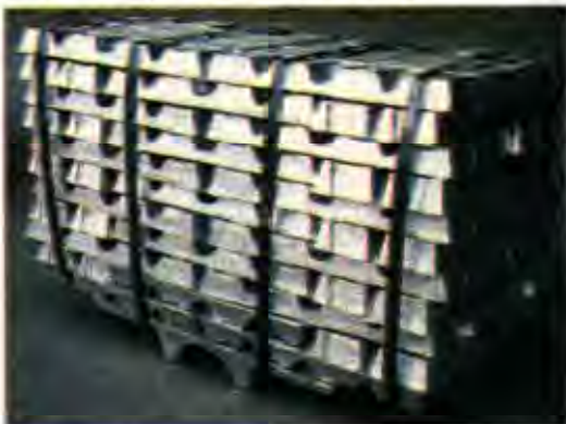
Iranian aluminum ingot is widely available in Turkey at $70-75 per ton.

Anticipating a stronger dollar, investors have pulled money out of emerging economies. Turkey's GDP growth slowed to below 3% last year from 9% in 2010 and 2011, while inflation of around 8% is far above the government's 5% target.