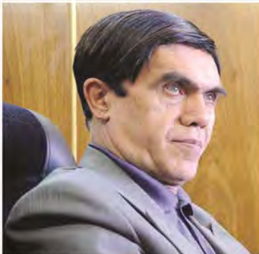
معاون مدیرکل دفتر برنامه‌ریزی و اقتصاد صنعتی