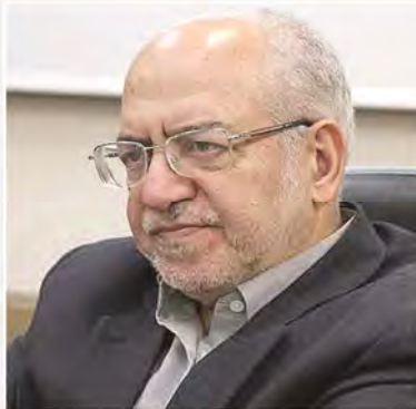
مدیرکل دفتر برنامه‌ریزی و اقتصاد صنعتی

ایران باید شریک راهبردی اتحادیه اروپا شود