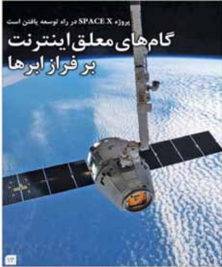
پروژه Space X در راه توسعه یافتن است

شماره ۲۵۶ - ۱۳۹۵ - آبان ماه ۱۹ مهر ۱۳۹۵ - سال سوم www.farsetanet.ir