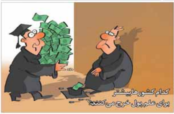
کدام کشورها بیشتر برای علم پول خرج می‌کنند؟