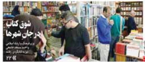
شوق کتاب در جان شهرها بزرگترین بازار کتابهای چاپی و دیجیتال در مشهد روزه کتابخوانی رونق گرفته

بر اساس گزارش رسمی وزارت نفت، صادرات نفت ایران در ماههای مهر و آبان به کشورهای آسیایی نسبت به ماه مشابه سال گذشته بالغ بر ۹۲ درصد افزایش نشان می دهد. ایران در مهر سال جاری برای نخستین بار از زمان لغو تحریم ها، صادرات نفت به فرانسه را آغاز کرد و با صادرات روزانه بیش از ۲۰۰ هزار بشکه، بزرگترین صادرکننده نفت خام به این کشور شد. کشورمان در ماه آکتوبر با صادرات روزانه ۷۸۹ هزار بشکه نفت با پشت سر گذاشتن عربستان به بزرگترین تأمین کننده نفت هند تبدیل شد.