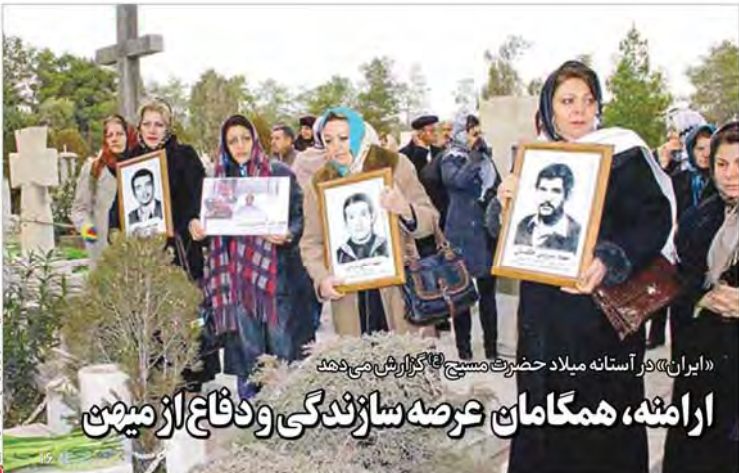
«ایران» در آستانه میلاد حضرت مسیح موعود و ائمه اطهار (عج) برگزار می‌کند ارامنه، همگامان عرصه سازندگی و دفاع از میهن شماره ۱۳۹۵ دی ۲۴ پارازیت‌ها در ابتلا به سرطان مؤثرند هیات مدیره انجمن صنفی روزنامه‌نگاران استان تهران انتخاب شد در قمارخانه‌های پنهان پایتخت چه می‌گذرد؟ میزبانی پرسود در خانه‌های «پوکر»