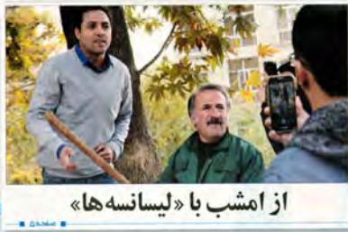
از آتش با «لیسانسه‌ها»