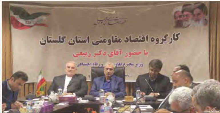
وزیر تعاون، کار و رفاه اجتماعی خبر داد: