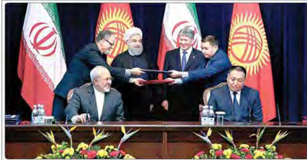
اعلام نقشه راه همکاری‌های ده ساله ایران و قرقیزستان

«رئیس‌جمهوری روسیه تخلیه ۱۰۰ هزار نفر از حلب بزرگ‌ترین عملیات انسانی در جهان بود که این امر بدون کمک نیروهای ایران میسر نمی‌شد» «پوتین دستور توسعه تأسیسات دریایی روسیه در سوریه را صادر کرد» «ارتش سوریه رسماً آزادی کامل شهر حلب را اعلام کرد» «سید حسن نصرالله طرح تشکلات برای سرنگونی نظام سوریه با آزادسازی حلب شکست خورد» «حجم حمایت از تروریست‌ها در حلب دهها برابر پیش از آن شد» «کتاب به ملت فلسطین بود» «۸۸ غیرنظامی در حمله هوایی ترکیه به شهر البتاب سوریه کشته شدند» «آخرین کشته‌های جنگ سوریه ۲۱۰ هزار تن اعلام شد» «وزارت خارجه آمریکا تری نسبت به نتایج سیاست‌های آمریکا در سوریه تأکید شده است»