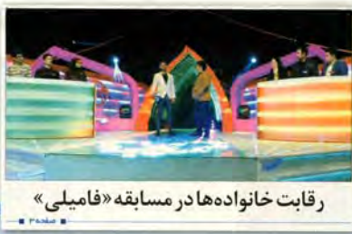
رقابت خانواده‌ها در مسابقه «فامیلی»

گزارش جام جم از مصوبه مجلس برای ایجاد سامانه ثبت حقوق و مزایای مسئولان