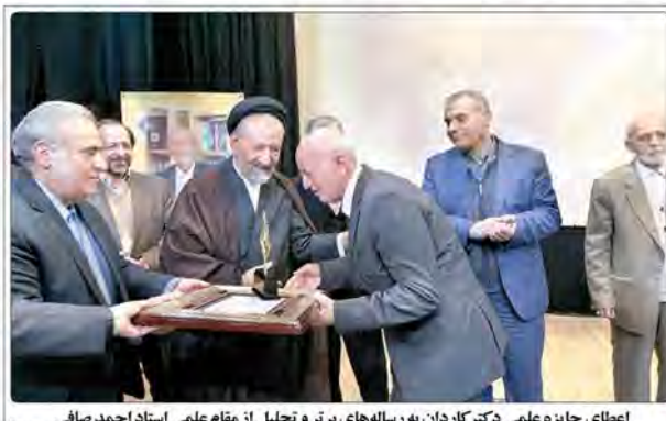
اعطای جایزه علمی دکتر کارداران به رساله‌های برتر و تجلیل از مقام علمی استاد احمد صافی

رئیس سازمان برنامه و بودجه، دولت مصمم به تمام طرح‌های اولویت‌دار است. ۲۰۰۰ طرح نیمه‌تمام به جا مانده داریم. بانک مرکزی با منتقد اقتصادی برای واقعی‌کردن نرخ ارز تلاش می‌کند. معاون وزیر صنعت ۱۴ هزار میلیارد تومان تسهیلات برای خروج صنایع از رکود اقتصادی پرداخت می‌شود. ۹۰۰ میلیارد تومان تسهیلات از صندوق توسعه ملی می‌گیرد. بانک تخصصی حمایت از شرکت‌های کوچک و متوسط تأسیس خواهد شد. هم‌اکنون بیش از ۲۰۰۰ طرح نیمه‌تمام جا مانده که دولت باید برای خروج صنایع از رکود اقتصادی پرداخت می‌شود. طرح‌های اولویت‌دار است. طرح‌های اولویت‌دار است. طرح‌های اولویت‌دار است.