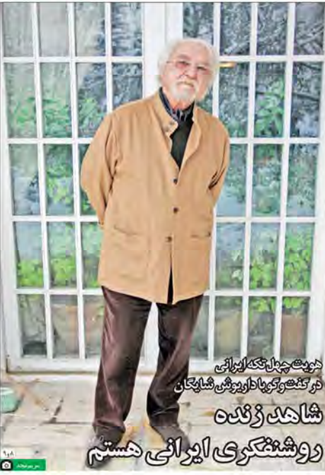
درباره چهل چنگ ایرانی فرگشته و گویا در روش‌های شایگان شاهد زنده روشن‌نگری ایرانی هشتم

با هر نگاه و رویتگری که به ساختار و مویج‌گیری‌های صدا و سیما نگست به دولت یازدهم بگردیم از این واقعیت تلخ می‌توانیم بگویم که این رسانه عملاً طرف سند و بی‌گناهی‌ها نیست که در حال دولت حسین روحانی گذشته می‌طرف «پودر دست» صد گفته که هیچکس نمی‌تواند صدای سیمای این طرف باشد و هیچکس هم اعتقاد ندارد که صدای سیمای مکتوب به بی‌طرفی است. به هر حال کسانی که در صدا و سیما هستند، کسانی که مسئول خبر هستند، کسانی که مسئول تحلیل‌های سیاسی هستند، کسانی که مسئول تهیه برنامه‌های سیاسی هستند، هر قدر صدای این‌ها بی‌طرفی داشته باشد، به هر حال فراوانی افکار، نگاه، مویج‌گیری‌های سیاسی خود هستند. بنابراین هیچکس از صدا و سیما انتظار بی‌طرفی ندارد. چه در مورد دولت‌های گذشته و چه چه در مورد دولت دیگری اما آنچه حداقل انتظار حکیم می‌کند داشتن برای نهاد و یک حداقلی در عقالت است. ندهد هیچ‌چیز اعتقاد به آنکه صدای و سیما موظف است، رعایت بی‌طرفی کند تا مردم چون عقلان نظر که گفته به هر حال مسئولان صدا و سیما برای آن گزارش‌های سیاسی خود هستند، اما آنچه انتظار داریم، رعایت حداقلی عقل و سیاست در نگاه به دولت یازدهم است و استفاده از روش‌های حداقل اعتقاد بوده که باعث آلودگی خاطر بسیاری می‌شود. بی‌الاف درست‌تر و صحه‌دارتر خواهد بود نگوییم صدا و سیما به حق رعایت بی‌طرفی، در حقیقت نوبت یکسان حملات اصولگرایان کشور است.