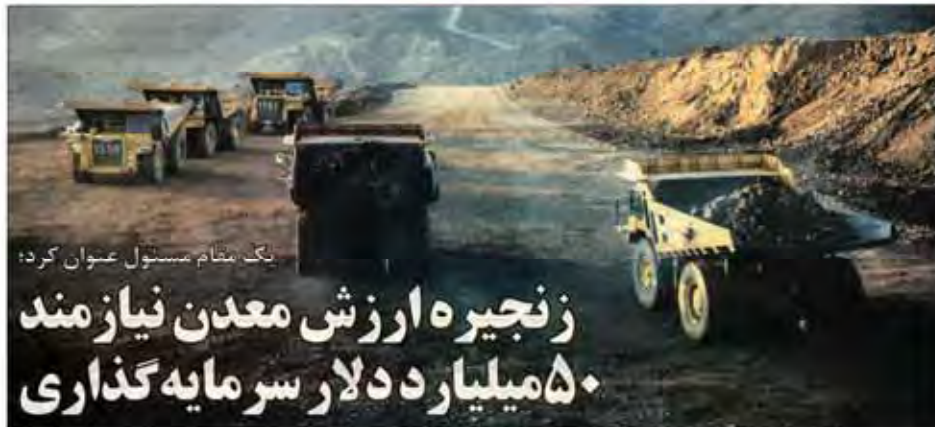
بگ، مقام مسئول عنوان کرد: