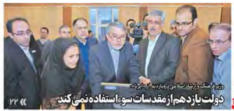
وزیر فرهنگ در بازدید از نمایشگاه «روزهای اسلامی» در موزه ملی ایران

پس از انتشار متن سخنان مسلوب به نظریه، دیروز حمایت رسانه‌های منطقه از کریمی قویسی فوکش کرد