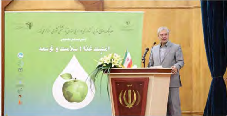
وزیر تعاون، کار و رفاه اجتماعی: اجازه ندادیم اقشار ضعیف از مصرف لبنیات محروم شوند