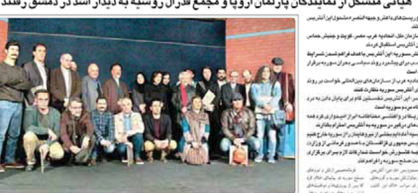
تجلیل از بهترین‌های طراحی کتاب در ایران