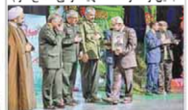
تجلیل از خانواده ۳۱ شهید قرآنی مدافع حرم