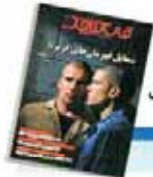
شما بیل قهرمان‌های گریزها

کارشناسان در گفت و گو با جام جم نقش رسانه ملی را در ترویج از دواج بررسی می‌کنند