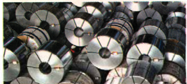
Tariff rates on flat steel imports have been cut by half to 10% to balance the domestic steel market.

China-origin hot dipped galvanized coil was available at $670-700 per ton CFR. Metal Bulletin's assessment for imported HDG in Iran was $670-700 per ton CFR Iranian ports, compared with the preceding week's $660-670 per ton CFR.