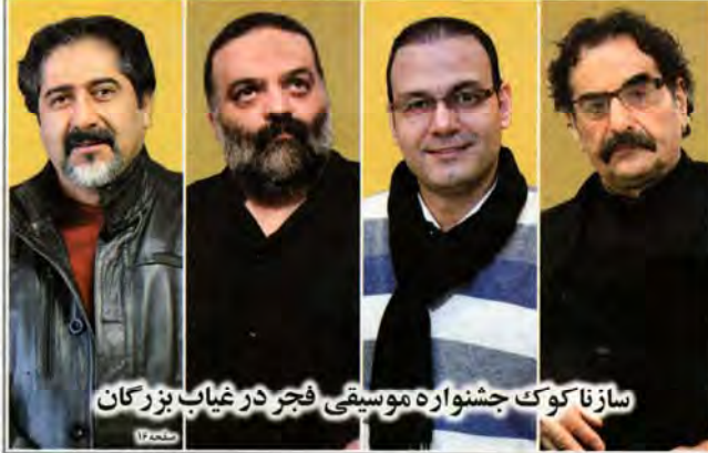
سازنا کوک جشنواره موسیقی فجر در غیاب بزرگان