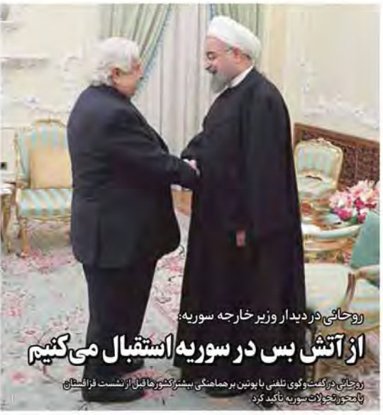
روحانی در دیدار وزیر خارجه سوریه: از آتش بس در سوریه استقبال می‌کنیم

روحانی در گفت‌وگوی تلفنی با پوتین بر هماهنگی بیشتر کشورها قبل از نشست فراستایف با محوریت بحران سوریه تأکید کرد.