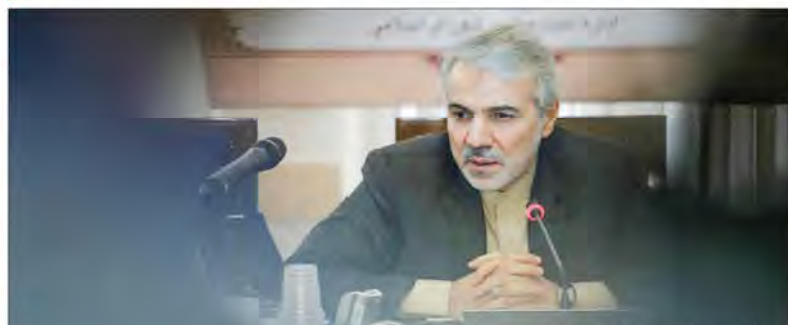
سخنگوی دولت در پاسخ به «تعاادل»: