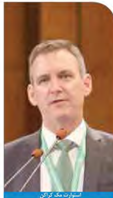
استوارت مک کراکن

در واقع حضور ۶۴ شرکت صاحبنام بین‌المللی از ۱۷ کشور جهان در این نشست تخصصی و علاقه‌مندی روزافزون شرکت‌های خارجی برای توسعه روابط خود با ایران برای سرمایه‌گذاری در این بخش مزیت است. سازمان دولتی ایمیدرو با توجه به وظایف خود یعنی توسعه بخش معدن، مسیر را با حمایت‌های لازم از بخش خصوصی فعال در این صنعت و از طریق مهیا کردن زیرساخت‌ها هموار می‌کند. این اجلاس الگویی است که می‌تواند با شناساندن ظرفیت‌های ایران در بخش معدن از ظرفیت‌های سرمایه‌گذاران بزرگ استفاده کند.