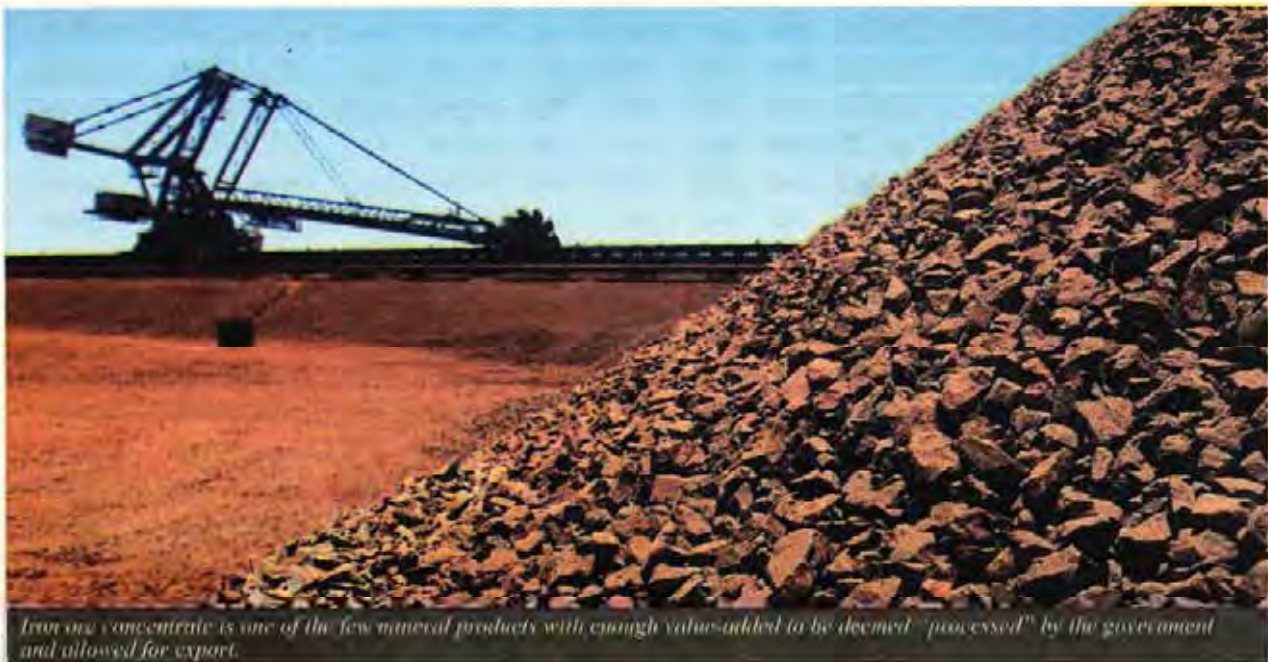
Iron ore concentrate is one of the few mineral products with enough value added to be deemed "processed" by the government and allowed for export.

Iron Ore Tops Charts With 22.9m Tons, Up 18.29% Y-O-Y