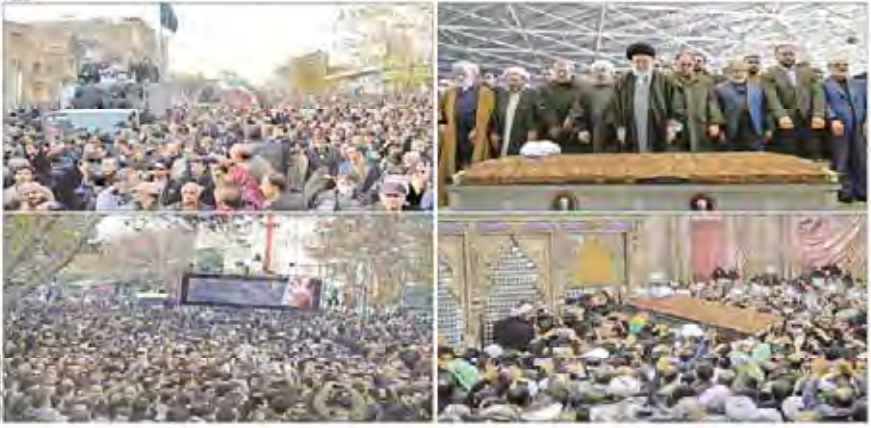
تشیع با شکوه پیکر آیت‌الله هاشمی رفسنجانی