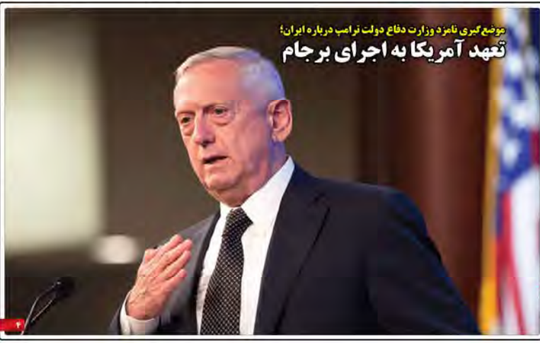
موضع گیری نامزد وزارت دفاع دولت ترامپ درباره ایران؛ تعهد آمریکا به اجرای برجام