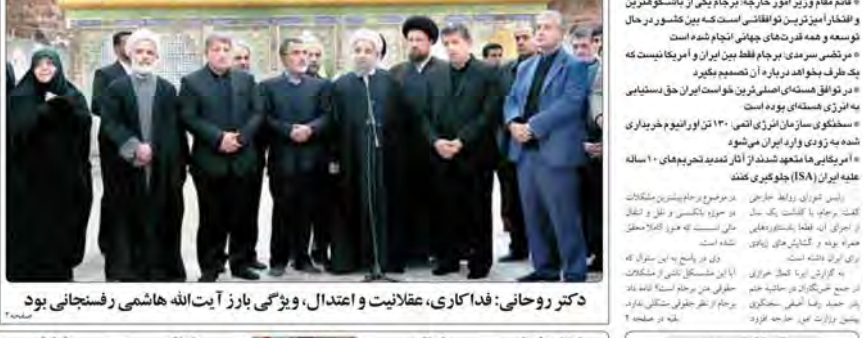
دکتر روحانی: فداکاری، عدالت و ویژگی بارز آیت‌الله هاشمی رفسنجانی بود

دکتر کمال خرازی: برجام گشایش‌های زیادی برای ایران ایجاد کرده است