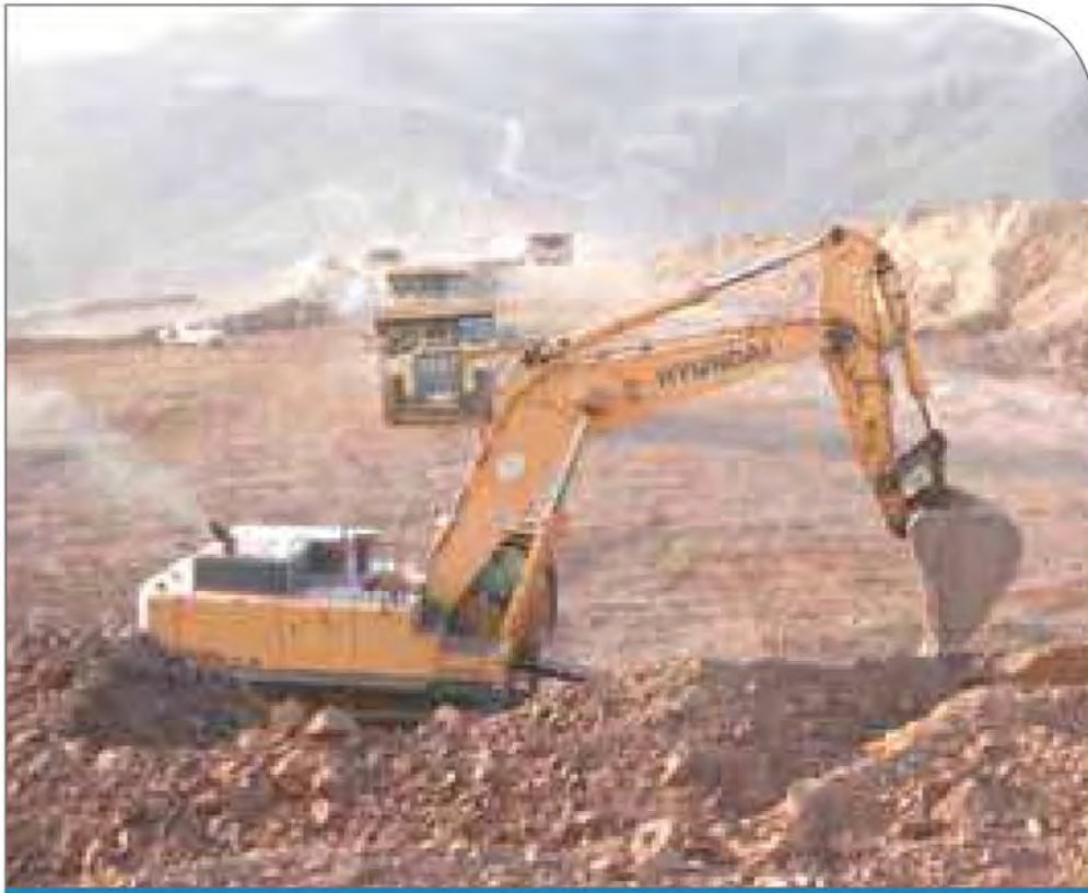
معدن سنگان

با آن روبه‌رو هستند. ایران بر موضع خود در ایجاد ذخایر 700 ماینینگ در ادامه می‌گوید. مقامات رسمی میلیاردها دلار از مواد معدنی این کشور مانند