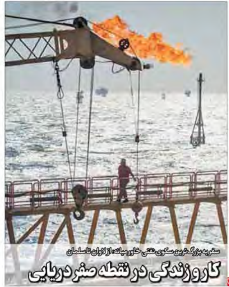
شهریه بزرگ سونگ می‌کشی خاورمیانه از آژانس تا سلیمان کار و زندگی در تنگه صحر در یابی

این رسانه‌ها بعضاً با سرمایه‌های عمومی و بیت‌المال می‌کوشند دولت و مجلس برآمده از آرای ملت را بر ذهن مردم ناگوار کند حضور مردم در تشییع پیام‌های زیادی داشت آیت‌الله هاشمی به توانمندی و نقش زنان در سطوح مختلف باور داشت صالحی امیری، وزیر فرهنگ و ارشاد اسلامی: ارتقای انگوی سبک زندگی ایرانی اسلامی را نمی‌توان بدون نقش زنان و خانواده پیش برد مولوددی معاون روحانی در امور زنان: نیسی از شاغلان رسانه را زنان تشکیل می‌دهند، ۲۰ درصد از مدیران مسئول رسانه‌های زن هستند و ۲۵ نشریه ویژه زنان منتشر می‌شود