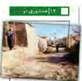
هوای پاک روستای پاک

آمادگی وزارتخانه‌های ای شفافیت اطلاعات؛ تقریباً هیچ کسب‌وکار مستترسی از به اطلاعات بهره‌ری گزارشی از میزان آمادگی دستگاه‌های اجرای قانون مستترسی از به اطلاعات می‌بخشد