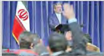
در مجموع بر یک سال گذشته، برجام خوب اثر کرده است و ما امروز با آمریکا قطع‌التعلیق پیوسته‌ای داریم. برجام اتفاق کرده و عمل ایجاد کرده است.

همه تحریم‌هایی که بر سر اقتصاد ایران وجود داشت با برجام از بین رفت!