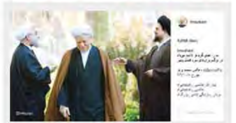
ایستادگزارم روحانی؛ ما را آبجای گرم تو امید می‌داد / در برگ‌ریزان‌های سرد فصل پاییز

صد و سیما قراری با من گذاشت و بعد دبه کرد