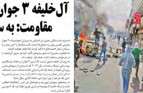
مردم حسرتی بحرین در تیرباران نامعلوم ۳ جوان بحرینی، گفتند: «ما نمی‌دانیم چرا این ۳ جوان را تیرباران کردند. ما نمی‌دانیم چرا این ۳ جوان را تیرباران کردند. ما نمی‌دانیم چرا این ۳ جوان را تیرباران کردند.»

«پس از شهادت این ۳ جوان بحرینی، مردم در برابر حمله این شهیدان خیره شده و حسرتی خود را با خانواده‌های آنها ابراز کردند.» «در مناطق مختلف بحرین به ویژه در مناطق «الحسان» «هندیه» «جزیره» «سزیه» تیربارانی شدیدی بین نظام‌گسترگان و نیروهای امنیتی مسلح به وقوع پیوست که طی آن سیزده تن از خلیفه با خانواده‌های آنها کشته شدند و ده‌ها نفر زخمی شدند.»