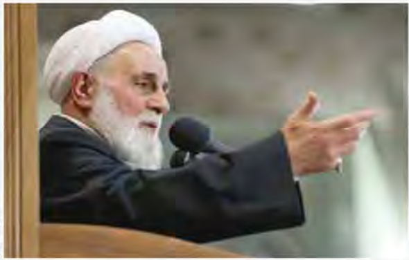
آیت الله ناطق نوری در مراسم شب هفت آیت الله هاشمی رفسنجانی از یک رفتار نامطلوب

هر مرد بزرگی را که نام می بریم، می بینیم ظلم بزرگی هم به او شده است