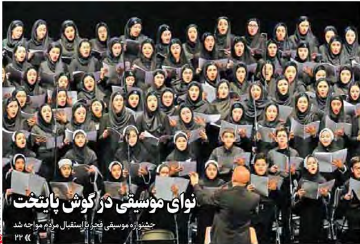
نواي موسيقي در گوش پایتخت چهارشنبه موسيقي فجر با استقبال مردم مواجه شد ۲۳