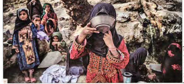
بحران آب شرب در ۵۲۰ شهر و ۷۵۰۰ روستا

رئیس جمهور منتخب آمریکا که به برجام به عنوان یک معامله تجاری نگاه می‌کند، در جدیدترین اظهار نظر خود از پرداخت ۱۵۰ میلیارد دلار به ایران پس از توافق اعلام نارضایتی کرد.