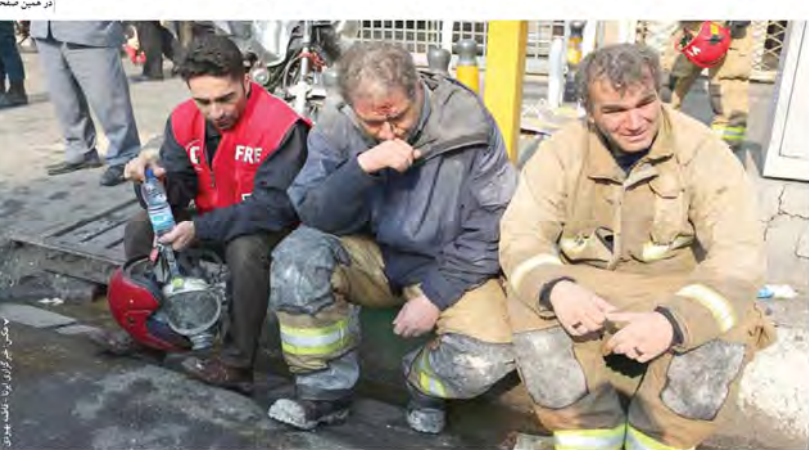
تکاهی گذرا بر مراسم تحلیف ترامپ؛ سوگند بر اصول محافظه کاران