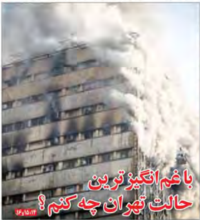
با غم انگیزترین حالت تهران چه کنم؟

بود و ما هر کدام شکایت می‌کردیم صدای‌مان به جایی نمی‌رسید. پس در این مدت (پس از اجرائی شدن برجام، حرکت برعکس شد. این عضو کابینه دولت پانزدهم اظهار کرد: البته ما نمی‌گوییم که چیز فوق‌العاده‌ای انجام شده اما نسبت به زمان تحریم این ادعا را داریم که شاهد تغییرات مثبت در بخش تولید و صنعت هستیم.