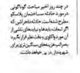
تأکید شورای شهر