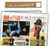
ادامه هفته ۱۸ لیگ برتر