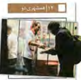
کاشی برای کوخ‌نشینان