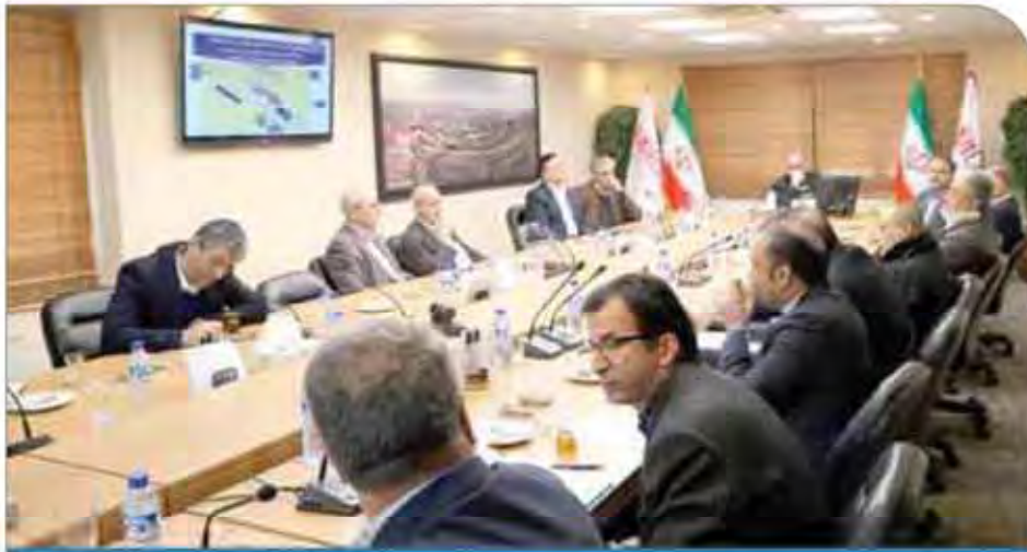
نگارخانه: توسعه قبل

بازمی‌گردد، امروزه به‌عنوان یکی از ذخایر بزرگ سنگ‌آهن کشور به‌شمار می‌آید. به همین دلیل شاهد سرمایه‌گذاری‌های گسترده از سوی فعالان بخش خصوصی در حوزه معدن و صنایع معدنی در این پروژه بزرگ هستیم.