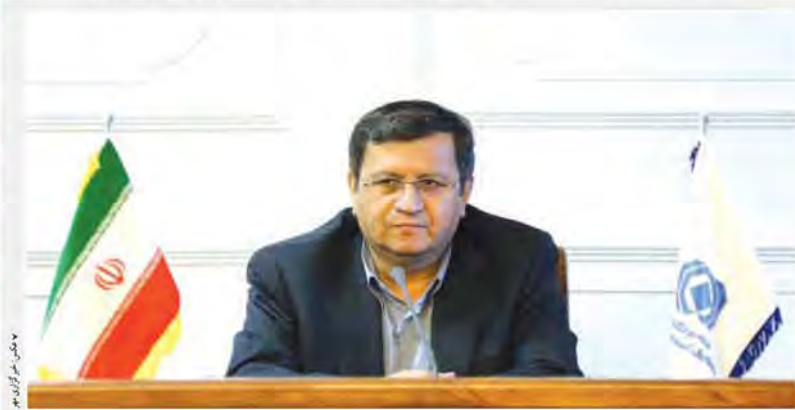
رئیس کل بیمه مرکزی خبر داد: