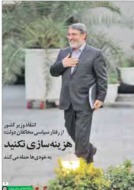
با اعتماد در سخنرانی توسعه

انتقاد وزیر کشور از رفتار سیاسی مخالفان دولت: هزینه سازی نکنید