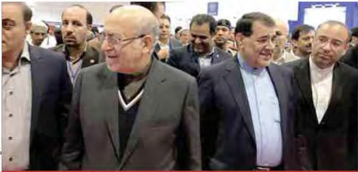
نگارخانه از صفحه قبل