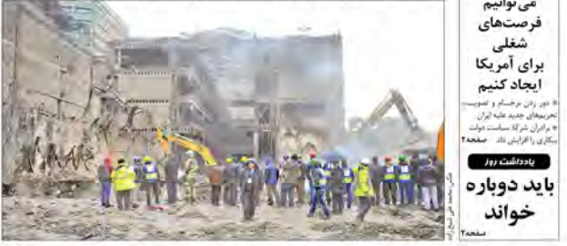
عملیات آواربرداری ساختمان پلاسکو به پایان رسید.