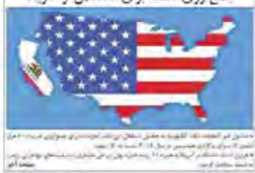
جدایی طلبان کالیفرنیا هم دست به کار شدند و جمع‌آوری امضاء برای استقلال از آمریکا را آغاز کردند.