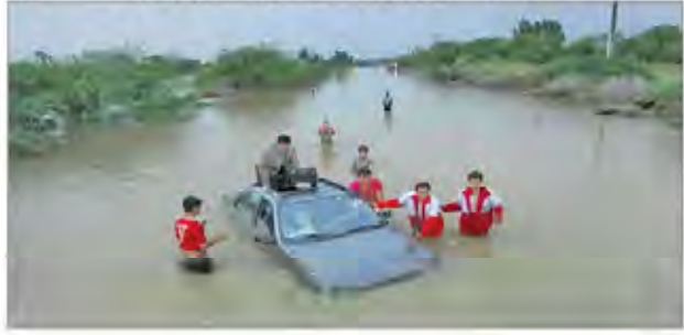
سیلاب سیستان و بلوچستان جان یک نفر را گرفت و خسارت زیادی به اموال مردم در این مناطق وارد کرد.