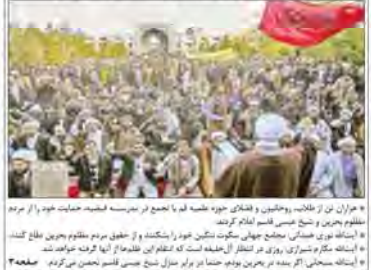
● هزاران تن از طلاب، روحانیون و قضایای حوزه علمیه قم با تجمع در ترمینال شهید مطهری حمایت خود را از مردم مظلوم بحرین و شیخ حسن قاسم احمد کردند. ● این تعداد از قیام جمعی روحانیان و طلاب بحرین را پشتیبانی کردند. ● این تعداد در حمایت از قیام مردم مظلوم بحرین جمع شدند. ● این تعداد در حمایت از قیام مردم مظلوم بحرین جمع شدند.