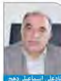
تادعلی اسماعیلی دهج