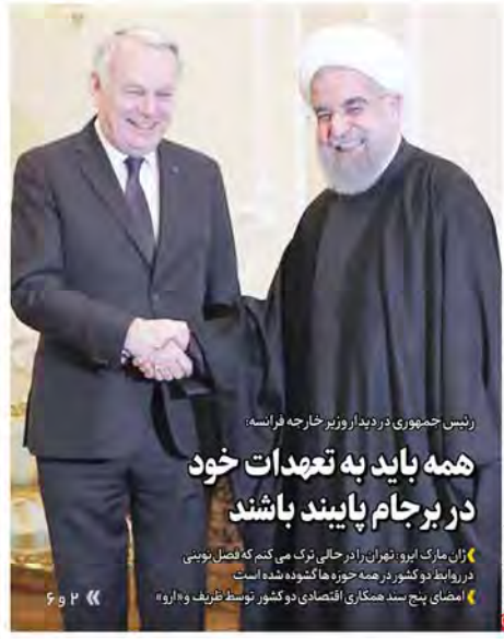
رئیس جمهوری در دیدار وزیر خارجه فرانسه