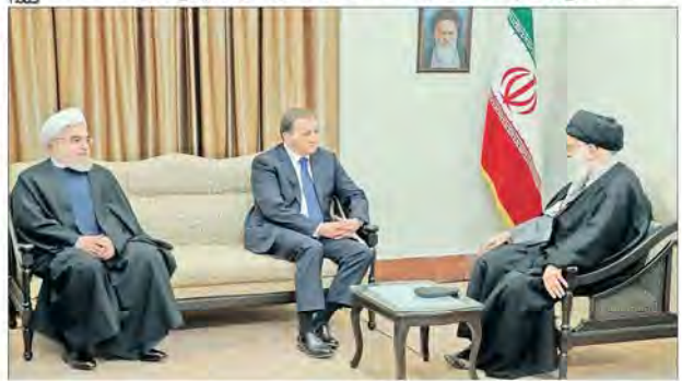
مقام معظم رهبری در دیدار نخست‌وزیر سوئد

تحلیلگران غربی از درک عظمت حضور حماسی مردم ایران عاجزند انتظار می‌رود توافقات با سوئد مانند اغلب کشورهای اروپایی روی کاغذ نماند