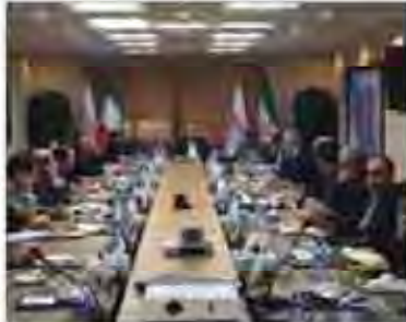
هم‌اندیشی رییس هیات عامل ایمیدرو با اقتصاددانان