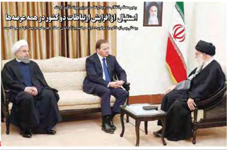
مخالفت مجمع تشخیص مصلحت با بازنگری پیش از موعد زنان با بازنگری پیش از موعد زنان مجمع «نور» مناسب بازار پوشاک نیست دربی، دنیای هیجان