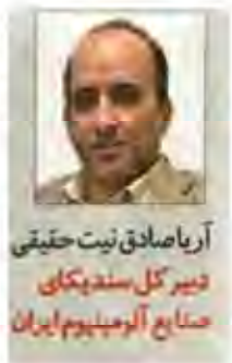
آریا صادق نیت حقیقی مدیر کل صنعت و معدن صنایع آلومینیوم ایران

صنعت از صنایع بالادستی تا صنایع پایین دستی آلومینیوم وارد آورده است. بنابراین به نظر می رسد برای برون رفت از این چالش باید چند راهکار به صورت همزمان مورد توجه قرار گیرد.