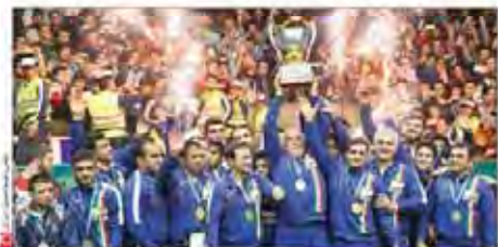
ششمین قهرمانی متوالی آزادکاران ایران در جام جهانی ثبت شد صدور ویزای قهرمانی با مهر پیروزی بر آمریکا

وزیر امور خارجه در سفر استقامت گسترده در آن کشور به کارهای دیپلماتیک و فرهنگی برای گسترش همکاریها با آن کشور پرداخته است