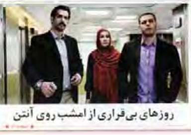
روزهای بی‌قراری از امشب روی آنتن

فارس، بوشهر و کرمان ملی چند روز اخیر از بحران جوی، خسارت دیدند