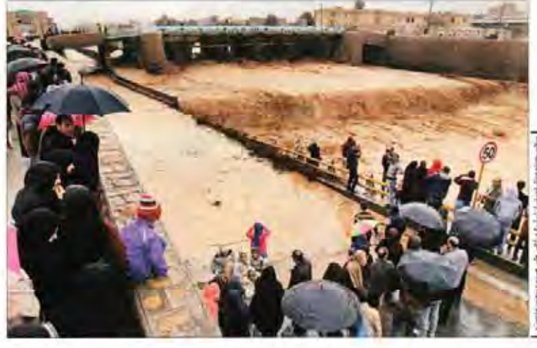
تجمع مردم در خیابان‌های تهران

رشد برخی کسب و کارهای نوین در کشور با استفاده از سیاست‌های نوین اقتصادی می‌تواند ایران را به یک کشور پیشرفته تبدیل کند.