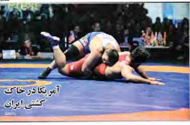
آمریکا در خاک کشتی ایران

حمله تروریستی داعش به زیارتگاهی در «سند» پاکستان ۸۰ کشته و ۲۵۰ زخمی برجا گذاشت داعشیان زمانی که به کشتن فرانسویان در منطقه امداد برسانند به زنیان ۲۰۰۰ نفر از پاکستانی‌ها در میان جانمندان این منطقه رویش هستند.