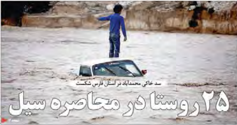
سد خاکی محمداباد در استان فارس شکست ۲۵ روستا در محاصره سیل

بسیار از سرمایه‌گذاران ایرانی در آذرماه سپرده‌های بلندمدت خود را به حساب‌های جاری منتقل کردند. این تغییر جهت سپرده‌گذاری می‌تواند به دلیل نگرانی‌ها از وضعیت اقتصادی باشد. همچنین، افزایش نرخ سود بانکی نیز می‌تواند یکی از دلایل این تغییر باشد.