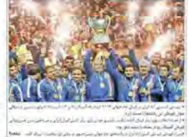
دستاوردهای تیم جهانی فتنی از اردن در مرحله به پایل رسید. تیم ملی فوتبال ایران در جام جهانی ۲۰۱۴ موفق به صعود به مرحله نهایی شد.

دستاوردهای تیم جهانی فتنی از اردن در مرحله به پایل رسید