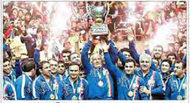
ایران قهرمان جام جهانی کشتی آزاد شد

تیم ملی کشتی آزاد ایران در دیدار فینال جام جهانی کشتی آزاد، روسیه را شکست داد و قهرمان شد. این تیم در تمام مسابقات شرکت کرده و موفق به کسب مدال طلا شد. این موفقیت برای کشتی‌گیران ایرانی بسیار ارزشمند است. در ادامه، تیم ملی کشتی آزاد ایران در دیدار دیگری نیز موفق به کسب مدال نقره شد. این تیم در تمام مسابقات شرکت کرده و موفق به کسب مدال نقره شد.