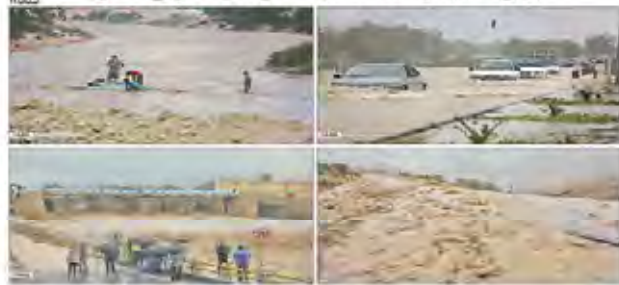
باران شدید و سیلاب در استان‌های جنوبی کشور. سیلاب‌ها در استان‌های هرمزگان، بوشهر و خوزستان خسارت‌های جدی ایجاد کرده است.

باران شدید و سیلاب در استان‌های جنوبی کشور