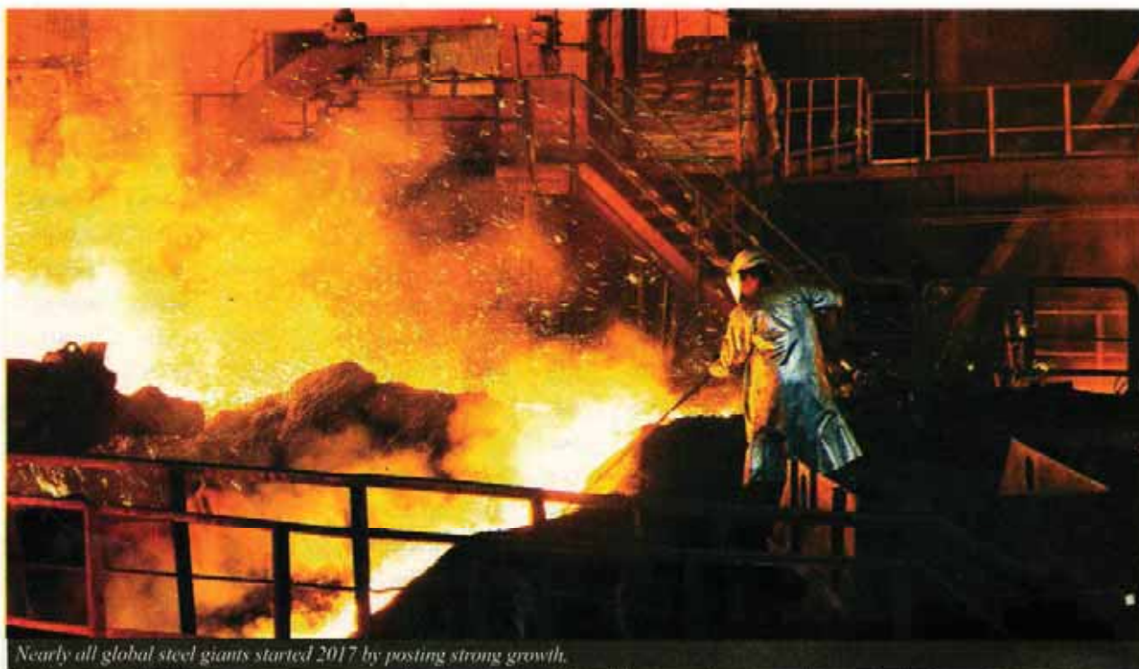
Nearly all global steel giants started 2017 by posting strong growth.