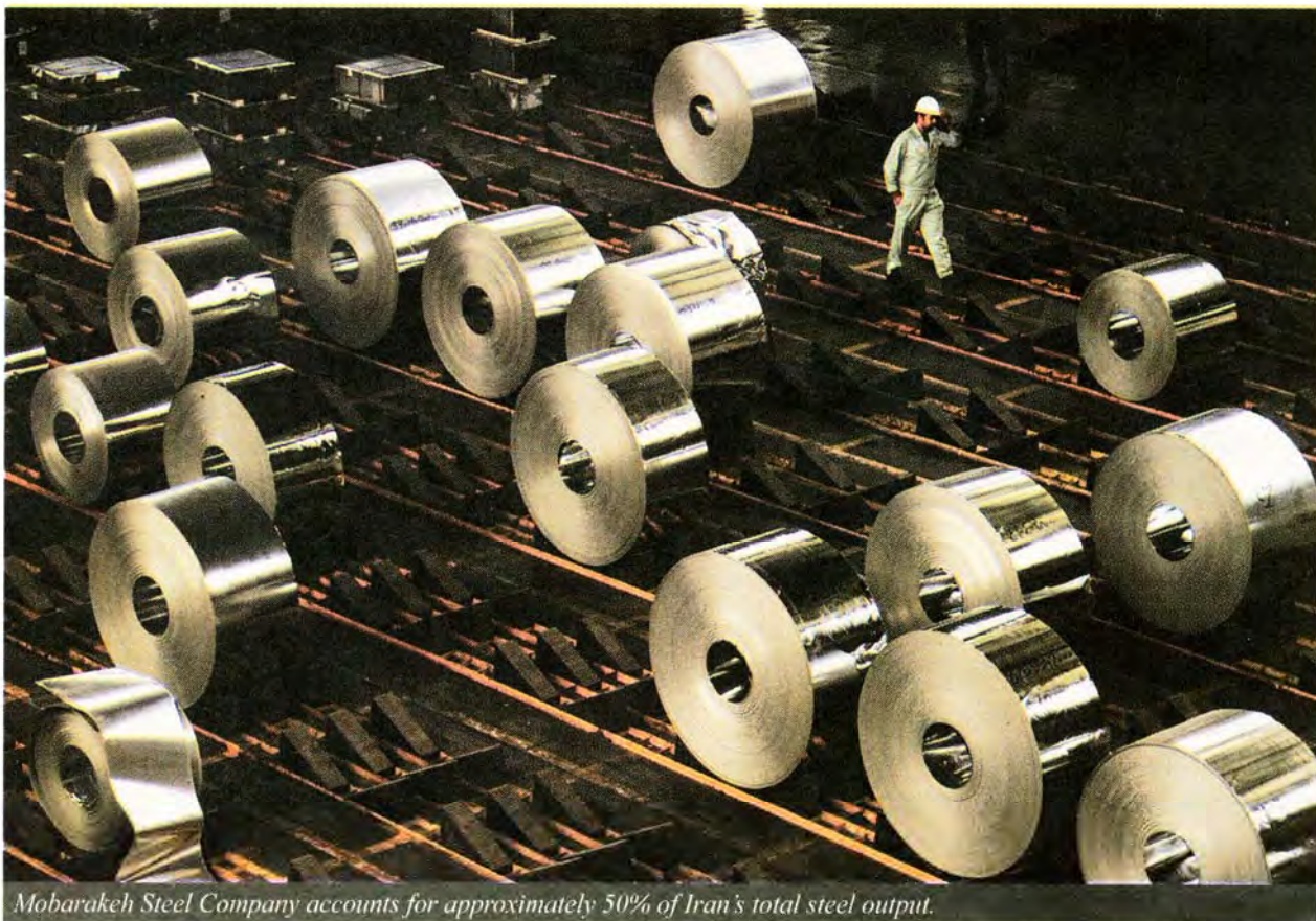
Mobarakeh Steel Company accounts for approximately 50% of Iran's total steel output.

share from domestic flat steel consumption, which stood at 7.5 million tons in the last fiscal year. It produced some 5.5 million tons of flat products during the period.