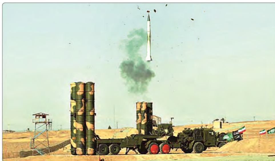
سامانه پدافندی «اس ۳۰۰» در ایران عملیاتی شد