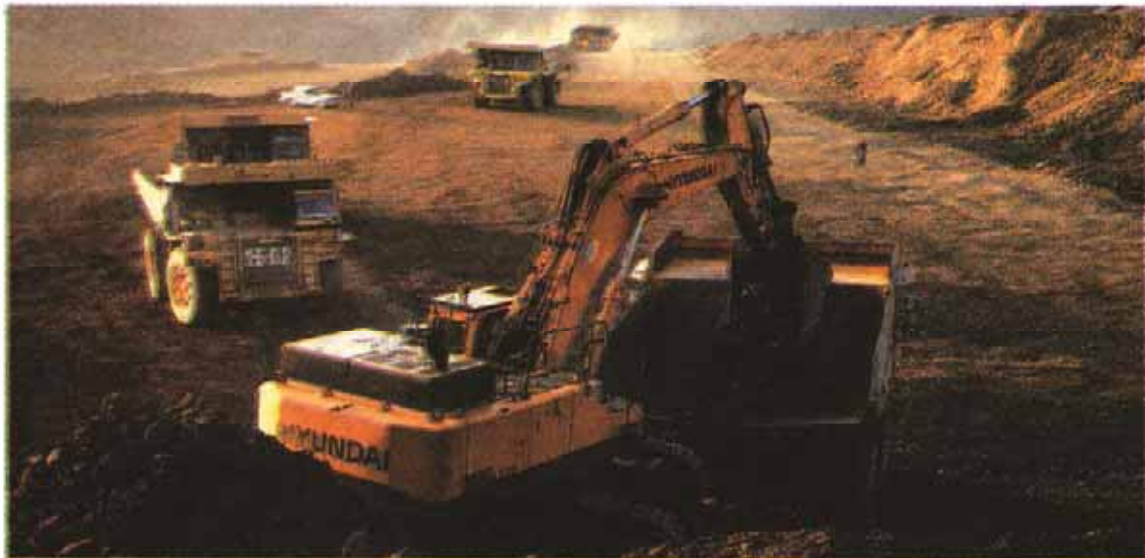
Known as "Iran's Mineral Heaven", Sangan Mineral Zone is home to over 1.2 billion tons of estimated iron ore reserves, which are expected to be much more.

metal shaped into balls and used as raw material for blast furnaces, which is used in integrated steelmaking, during which coke, iron ore and pellets react together under a hot air flow to form liquid hot metal, also called pig iron.