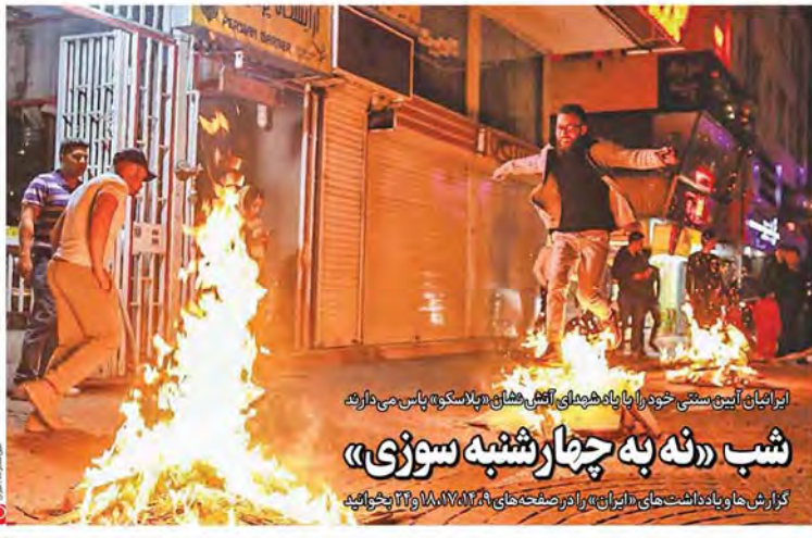
ایرانیان آیین سنتی خود را با یادشدهای آتش‌فشانی «پلاسکو» پاس می‌دارند شب «نه به چهارشنبه سوزی» گزارش‌ها و یادداشت‌های ایران را در صفحه‌های ۱۸ و ۱۷ و ۱۶ بخوانید

روحانی در دیدار رئیس و اعضای فراکسیون امید مجلس: