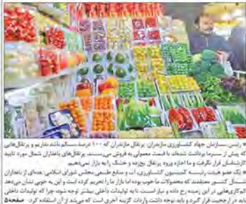
بازار شب عید در دست میوه وارداتی

تبعید شیخ عیسی قاسم تیر خلاص به حکومت دست‌نشانده آل خلیفه گزارش خبری تحلیلی کیهان تبعید شیخ عیسی قاسم، رهبر گروه فدائیان اسلام، به عراق و تبعید او به عراق، تیر خلاص به حکومت دست‌نشانده آل خلیفه است. این تبعید، که پس از سال‌ها زندان در ایران و تبعید به عراق، انجام شده است، نشان‌دهنده تغییر در سیاست‌های جمهوری اسلامی است. شیخ عیسی قاسم، که به دلیل فعالیت‌های سیاسی و تبلیغی در خارج از کشور به تبعید محکوم شده بود، اکنون به عراق منتقل شده است. این تبعید، که توسط مقامات ایرانی اعلام شد، نشان‌دهنده تغییر در سیاست‌های جمهوری اسلامی است. شیخ عیسی قاسم، که به دلیل فعالیت‌های سیاسی و تبلیغی در خارج از کشور به تبعید محکوم شده بود، اکنون به عراق منتقل شده است.