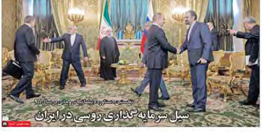
سیل سرمایه گذاری روسی در ایران