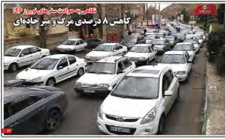
تنگنا به حوادث سفرهای نوروز ۹۶ کاهش ۸ درصدی مرگ و میر جاده‌های