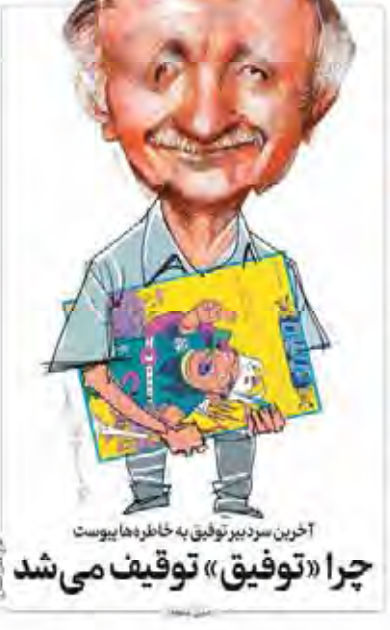
آخرین سردبیر توفیق به خاطرها پیوست چرا «توفیق» توقیف می شد