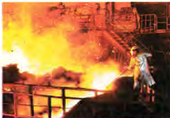
WSA data on global steel production during the first two months of 2017 show Iran was the world's 14th largest steelmaker.

Iran was the world's 14th largest steelmaker, as it was placed between Mexico (13th) with a 3.22-million-ton output