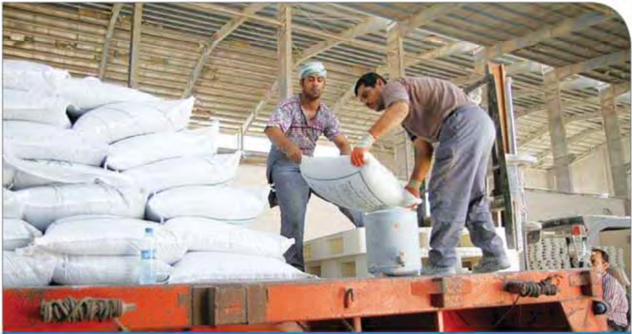
نگاره: نقشه از صنایع معدنی