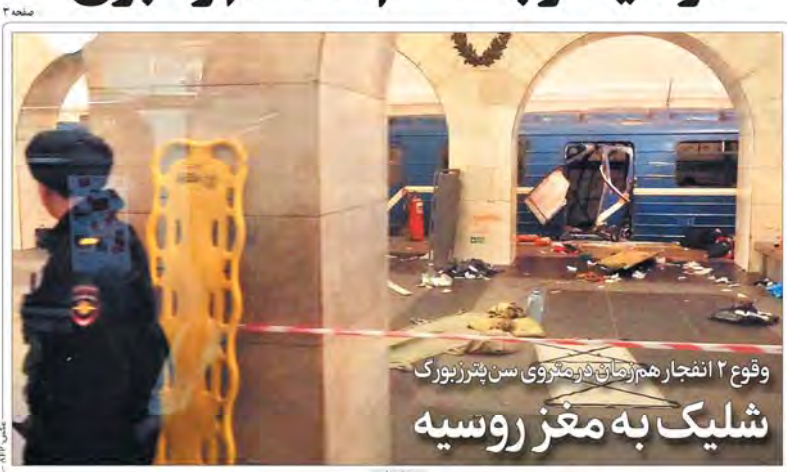
وقوع ۲ انفجار هم‌زمان در متروی سن پترزبورگ شلیک به مغز روسیه

سن پترزبورگ؛ شوک روسیه پروام اصحابان، کارشناس روسیه