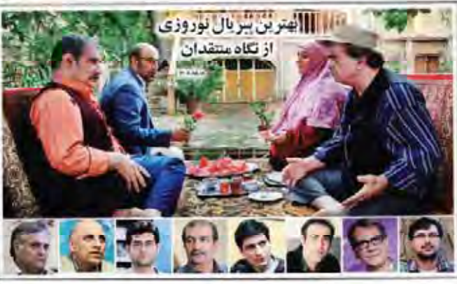
بهترین بزرگان نوری از نگاه منتقدان

حمله به سوریه خطای راهبردی است، آمریکا مدلی اروپا گرفتار چریک‌ها تکمیری خواهد شد