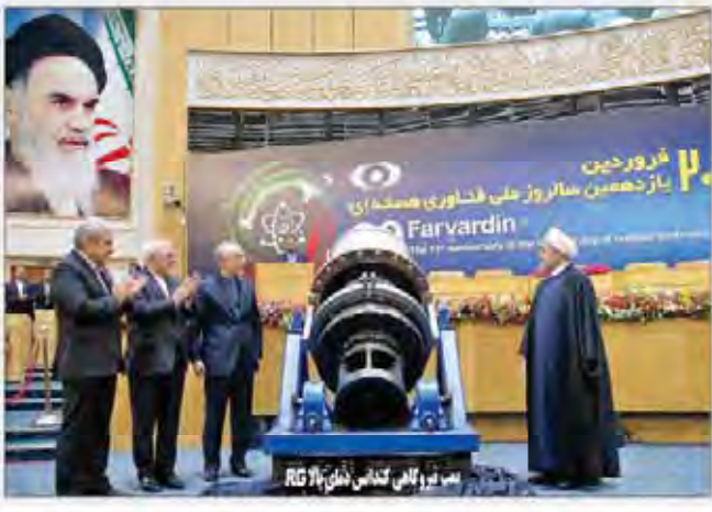
بزرگ‌ترین قطعه توربین بزرگ‌ترین نیروگاه هسته‌ای جهان در تبریز

دکتر حسن روحانی رئیس‌جمهور در بازدید از مراکز مهم هسته‌ای وزارت انرژی اتمی در استان آذربایجان شرقی و از جمله مراکز مهم هسته‌ای شامل مراکز تحقیقاتی، آموزشی و پژوهشی و مراکز صنعتی و خدماتی را با حضور مسئولین استانی و مرکزی و تعدادی از نمایندگان هیئت مدیره و هیئت مدیران مراکز مهم هسته‌ای، دیدار و بازدید کرد. در این بازدید، روحانی به شرحی از دستاوردهای این مراکز و نقش آنها در توسعه هسته‌ای کشور و نقش آنها در صنعت و اقتصاد کشور پرداخت و از اهمیت این مراکز در توسعه صنعت هسته‌ای کشور یاد کرد. روحانی در ادامه از دستاوردهای این مراکز و نقش آنها در صنعت و اقتصاد کشور یاد کرد.