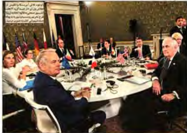
شکاف در ائتلاف غرب مقابل روسیه

ثبت نام برای ثبت نام در انتخابات ریاست جمهوری در روز نخست ۱۲۶ نفر ثبت نام کردند