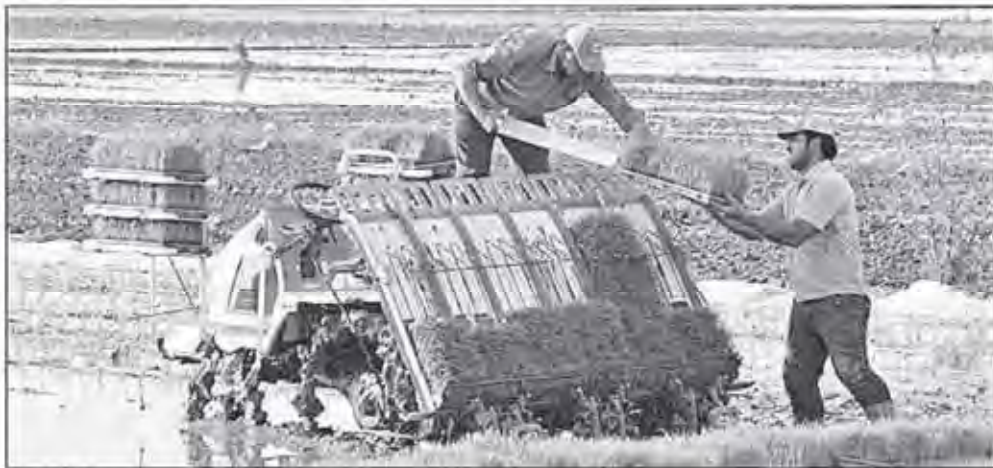
نشا مکانیزه برنج یا حضور وزیر جهاد کشاورزی

افتتاح کارخانه زغالشویی معاون وزیر صنعت، معدن و تجارت گفت: کارخانه زغالشویی سوادکوه که با علم و تکنولوژی روز به بهره برداری رسیده از لحاظ مصرف انرژی و پسماند کاهش قابل ملاحظه ای دارد. مهدی کرباسیان در مراسم افتتاح کارخانه زغالشویی سوادکوه افزود: ۷۰ درصد تولیدات این کارخانه یا ماشین آلات داخلی تولید می شود و فقط ۳۰ درصد تولیدات یا ماشین آلات خارجی انجام می شود. وی ادامه داد: این کارخانه نسبت به سایر کارخانه‌های زغالشویی ۲۰ درصد کمتر باطله