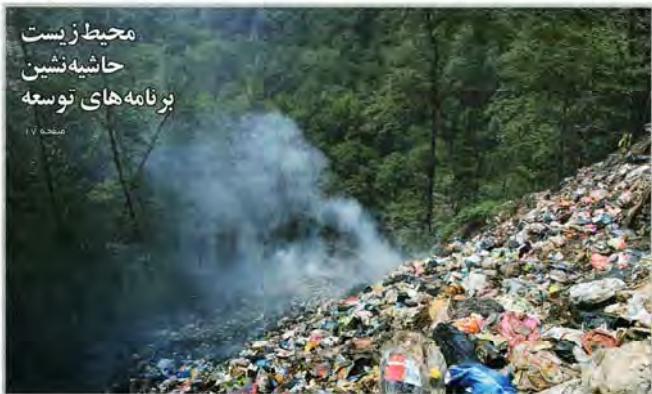
محیط زیست حاشیه نشین برنامه‌های توسعه