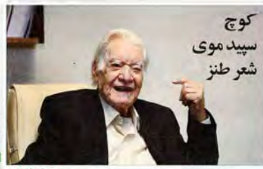
کوچ سید موی شعر طنز

روزنامه فرهنگی - اجتماعی صبح ایران - ۳۳ صفحه - ۳۳ شماره - ۳۳ شماره - ۳۳ شماره - ۳۳ شماره - ۳۳ شماره