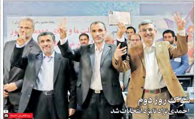
شوک روز دوم احمدی‌نژاد نامزد انتخابات شد سه‌ماهه از فعالیت انتخاباتی احمدی‌نژاد مهر ۹۵: از هیچ کاندیدایی حمایت نمی‌کنم ۲۳ فروردین ۹۶: نامزد انتخابات می‌شوم

«اعتقاد» بررسی کرد او چرا آمد؟ ۶ سناریوی کاندیداتوری احمدی‌نژاد گروه سیاسی مؤخرین در روز چهارم از میان کاندیدات نامزد انتخابات به دست وارد شد. انتخابات اکثر طوفان تشنه بود. حتی مشخص بود که از میان سینه سرسختان این حوزه و یک نفر نیست که کاندید شود. اما در حواشی انتخابات، احمدی‌نژاد با وجود اینکه کاندید نشده است، به نفع تمام ایرانیان است. در حالی که احمدی‌نژاد با کاندید شدن، به نفع تمام ایرانیان است.