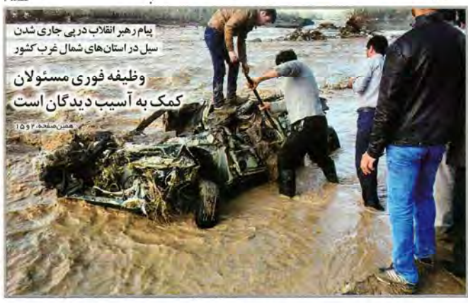
پیام رهبر انقلاب در پی جاری شدن سیل در استان های شمال غرب کشور وظیفه فوری مسئولان کمک به آسیب دیدگان است

■ خدایي: بسیاری از افرادی که نام نویسی کرده اند قطعا احراز صلاحیت نخواهند شد ■ بر اساس قانون، شورای نگهبان تا ۱۵ اردیبهشت برای بررسی صلاحیت نامزدها زمان دارد