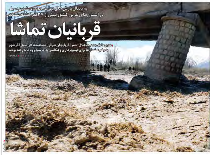
به دنبال بارش های بهاری و جاری شدن سیل در استان های غربی کشور بیش از ۳۷۰ نفر کشته شدند

از هر دو جریان اصولگرا و اصلاح طلب چهارهائی سیاسی زیادی در انتخابات ثبت نام کردند اسحاق جهانگیری، محمد هاشمی و محمدباقر قالیباف دیروز با حضور در وزارت کشور برای انتخابات ریاست جمهوری ثبت نام کردند