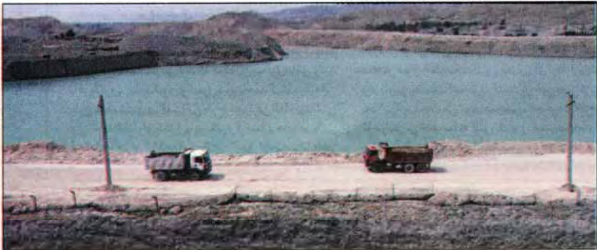
تصمیم گیری درباره فعالیت واحدهای آلاینده به عهده نهادهای دولتی است.

دارد و انتقال حجم زیادی از مصالح از فاصله دور به تهران هزینه زیادی در بر می گیرد و با توجه به حجم بالای ساخت و ساز، وجود این معادن برای شهر تهران یک مزیت به حساب می آید.