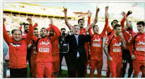
قهرمانی سرخپوشان در لیگ برتر

روزنامه فرهنگ - اجتماعی صبح ایران - ۴ صفحه ۴ سده ایران با من به نشانه ماه بارمندی ماه ۴۴ استان تهران و البرز - ۵۰۰ تومانی / دیگر استانها ۳۰۰ تومانی یکشنبه ۲۷ فروردین ۱۳۹۶ ۱۸ اردیبهشت ۱۳۹۶ ۱۶ آوریل ۲۰۱۷ ۲۷۹۹ شماره نشره www.jamejameonline.ir IAM-E-IAM Vol.17 No.4799 SUN APRIL 16 2017