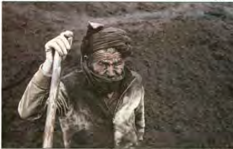
بیش از ۷ ماه از آخرین حقوق دریافتی کارگران بخش زغال سنگ کرمان می‌گذرد

در جلسه مدبرعامل صندوق بازنشستگی فولاد و مسئولان استانی شرکت‌های زغال سنگ کشور، شرکت ذوب آهن مکلف به پرداخت تمهیدات خود و افزایش قیمت زغال از ابتدای امسال شد. بر این اساس قیمت هر تن زغال سنگ از ۳۶۰ هزار تومان به ۴۵۰ هزار تومان افزایش خواهد یافت و شرکت ذوب آهن مکلف است قرارداد خود را با شرکت‌های زغال سنگ کشور اجرایی و عملیاتی کند.