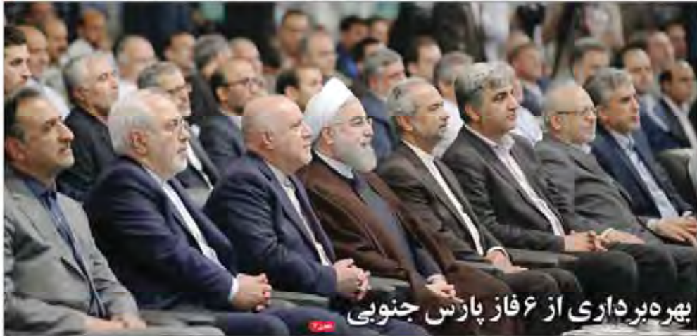
بهره‌داری از ۶ فاز پارس جنوبی

یکی از مواردی که واحدهای تولیدی و بخش خصوصی با آن درگیرند مالیات است. مدیران بزرگ واحدهای تولیدی در مورد بسیاری از بخش‌های مالیات از سوی دولت هستند. این گروه معتقد است که در شرایط رکود و تورم بالا، بخش‌های تولیدی فشار زیادی می‌شود. باید این فشارها را کم کرد و در این زمینه میزان بهای مصرف مالیاتی کمک کرد.