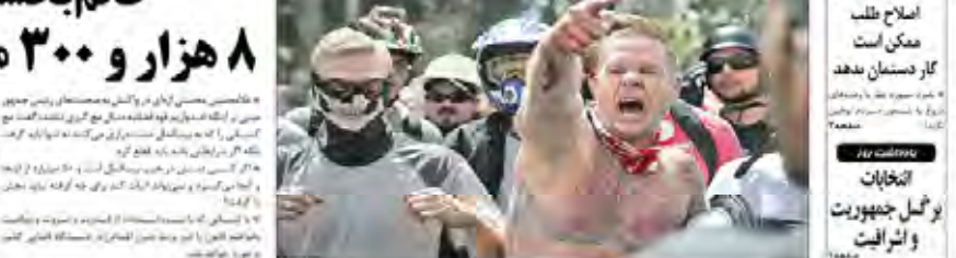
تظاهرات و هرج و مرج در ۱۵۰ شهر آمریکا، هواداران و مخالفان ترامپ به جان هم افتادند.

در این تظاهرات، طرفداران و مخالفان دونالد ترامپ درگیر درگیری‌های فیزیکی شدند.