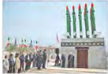
تعدادی از موشک‌های سبز که در نمایشگاه بین‌المللی دفاع و امنیت دریایی در تهران به نمایش درآمده است.

به گزارش خبرگزاری فارس، رهبران سیاسی آمریکا در حالی که بر دشمنی با ایران تأکید دارند، در عین حال بر این نکته تأکید دارند که اختلافات بین دو کشور قابل حل است.