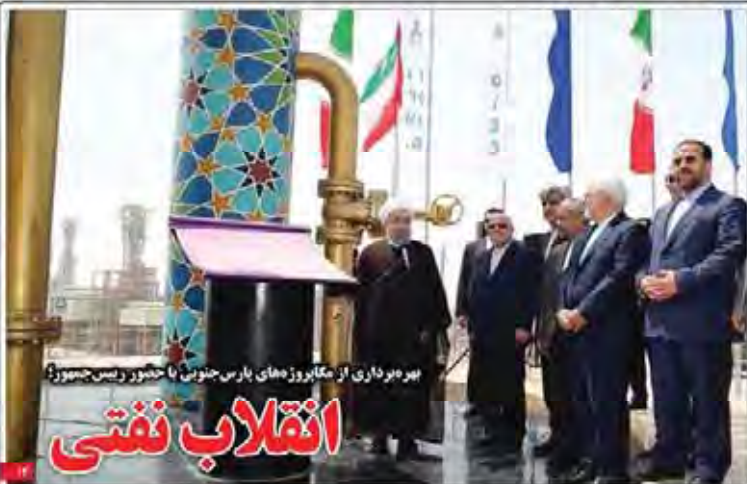
بهره‌داری از میادین نفتی پارس جنوبی با حضور رئیس جمهور انقلاب نفتی

جلسه استماع پرونده‌های سیاسی فهرده هاشمی - خان آیدام پارس مبارکی از برای آزادی زندانیان سیاسی مبارکی از برای آزادی زندانیان سیاسی مبارکی از برای آزادی زندانیان سیاسی