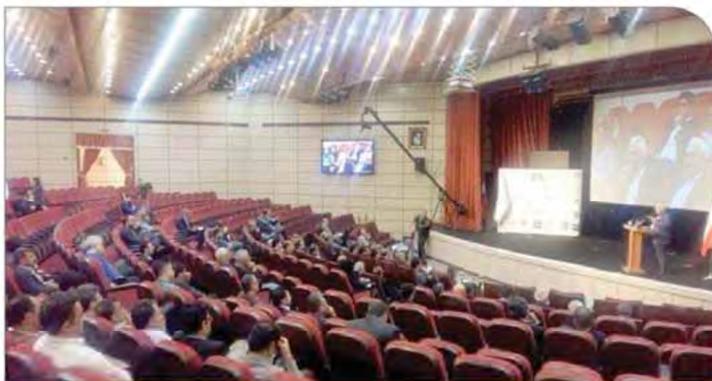
نگارخانه: مراسم افتتاحیه