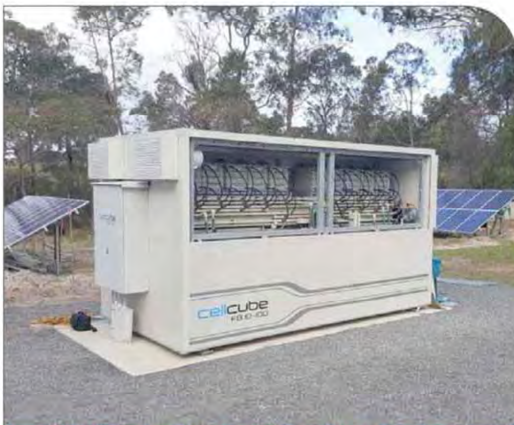
باتری جریان که باتری ردوکس هم نامیده می‌شود، با واتادیوم درست شده است

در واقع این ذخایر در سراسر پوسته زمین حاضر و موجودند و آنچه آنها را «نادر» می‌کند، این است که در حجمی که از نظر اقتصادی بهره‌برداری آن مقرون به صرفه باشد، در یک منطقه متمرکز نیستند و همین متمرکز نبودن، هزینه جست‌وجو و بهره‌برداری از آنها را بالا می‌برد.