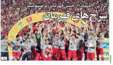
گزارش «اعتقاد» از جشن فخرمآنی بر زمینولیس سرخ‌های قهرمان

• دستور علی لاریجانی به هیات‌های نظارت بر انتخابات شوراهادر پی نامه آیت‌الله جنتی؛ ملاک، قانون کنونی است • با گفتارهایی از: علیرضا رحیمی، پروانه مافی قاسم، میرزایی نکو و عبدالکریم حسین زاده