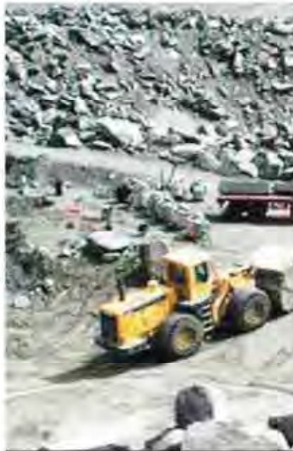
طرح افزایش ظرفیت خط گندله سازی که ظرفیت تولید گندله را از ۳.۴ میلیون تن به چهار میلیون تن خواهد رساند، در سال جاری به اتمام می‌رسد و تاکنون پیشرفت فیزیکی این طرح ۷۴ درصد بوده که از ۶۰۰ هزار تن افزایش ظرفیت نوسازی بینی شده است که ۲۰۰ هزار تن در سال قبل عملی و مابقی در سال جاری محقق خواهد شد.

در شرایطی که همچنان کشمکش تعیین قیمت سنگ آهن میان مسئولان معادن سنگ آهن و فولادکاران وجود دارد، رییس دفتر بودجه و گزارشات چادرملو از تخفیف ۵۰ درصدی سنگ آهن برای فولادسازان خبر می‌دهد.