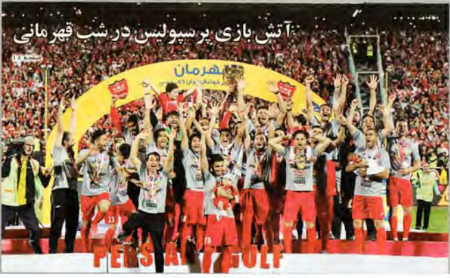
آتش بازی بر سیولینس در شب قهرمانی

ترس از دشمن اول بدبختی است بر روی مساله معیشت مردم و نیروهای مسلح و تقویت اقتصاد کشور تاکید دارم