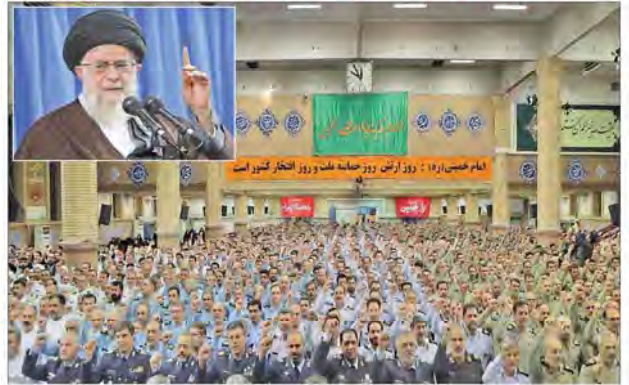
ایمان همتی: ۱۸ روز ازین روز خیمه علم و روز افتخار کشور است

اصلی‌ترین وظیفه مسئولان تلاش جدی برای حل مشکلات معیشتی مردم است