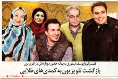
بازگشت تلویزیون به پهنه حضور دوباره‌اش در تلویزیون