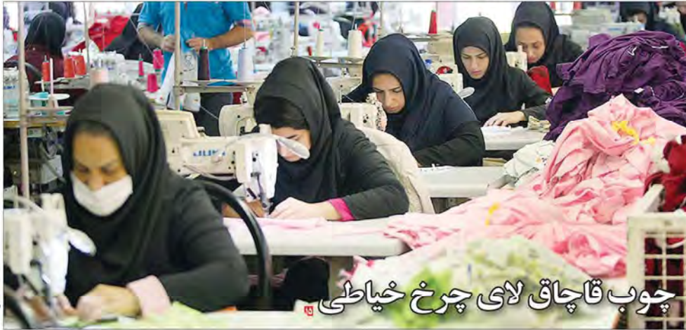
چوب قاچاق لای چرخ خیاطی

فرش ایران از جمله کالاهای رفاهی است که در میان سایر کشورهای جهان که دارای نشان برند هستند حرفی برای گفتن داشته و دارد. به جرات می‌توان گفت فرش و پاره‌های فرش دستباف ایرانی هر سال بیشترین کشورها شناخته شده و از آن به عنوان محصول صادراتی موفق یاد می‌شود. به گفته محمد شامعصرانه‌دور بر صنعت معادن و تجارت صادرات فرش دستباف