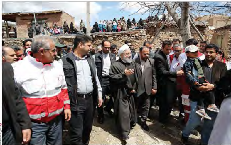
فصلی در تصویر

رئیس جمهوری در بازدید از مناطق سیل زده استان آذربایجان شرقی دستور داد بازسازی خانه‌های تخریب شده را آغاز کنید روحانی: هلال احمر و همه نیروهای امداد همواره در حوادث و بحران‌ها به خوبی عمل کرده‌اند