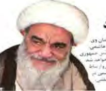
آیت‌الله هاشمی جزء تفکیک‌ناپذیر انقلاب و نظام بود

نیاز امروز دولتمردان آمریکایی از نگاه «ظریف» سردار سلیمانی در میان ۱۰۰ چهره تأثیرگذار جهان