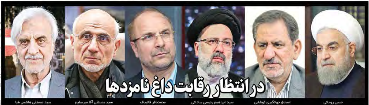
سید مصطفی هاشمی طباطبائی | سید مصطفی آقا میرسلیم | محمدباقر قالیباف | سید ابراهیم رئیسی ساداتی | اسحاق جهانگیری کوشایی | حسن روحانی

کمیسیون تبلیغات انتخابات ریاست جمهوری دیروز برای بازنگری در مصوبه جنجالی خود تشکیل جلسه داد، اما تصمیم گیری نهایی به امروز موکول شد نامزدهای انتخابات ریاست جمهوری، سازمان صدا و سیما و خطیب جمعه تهران از جمله معترضان اصلی پخش ضبط شده مناظره‌ها هستند