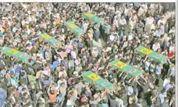
پیکرهای مطهر ۱۰ شهید مدافع حرم در قم و مشهد تشییع می‌شود.

تشییع پیکرهای مطهر ۱۰ شهید مدافع حرم در قم و مشهد