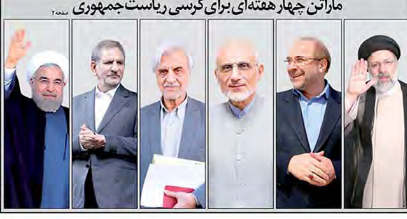
ماراتن چهار هفته‌ای برای کرسی ریاست جمهوری

سرمقاله وعده‌های اقتصادی در انتخابات دکتر موسی قزوینی بخش عمده‌ای از وعده‌های سیاستمداران در انتخابات، وعده‌های اقتصادی است. این وعده‌ها باید در راستای اجرای سیاست‌های اقتصاد مقاومتی و کاهش هزینه‌های سفر برای شهروندان ایرانی تدوین شود.