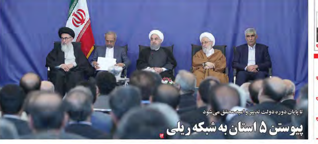
تا پایان دوره دولت تدبیر و امید متحقق می شود پیوستن ۵ استان به شبکه ریلی

نامزدهای دوره دوازدهم ریاست جمهوری معرفی شدند جشنواره جهانی فجر یک گام رو به جلو