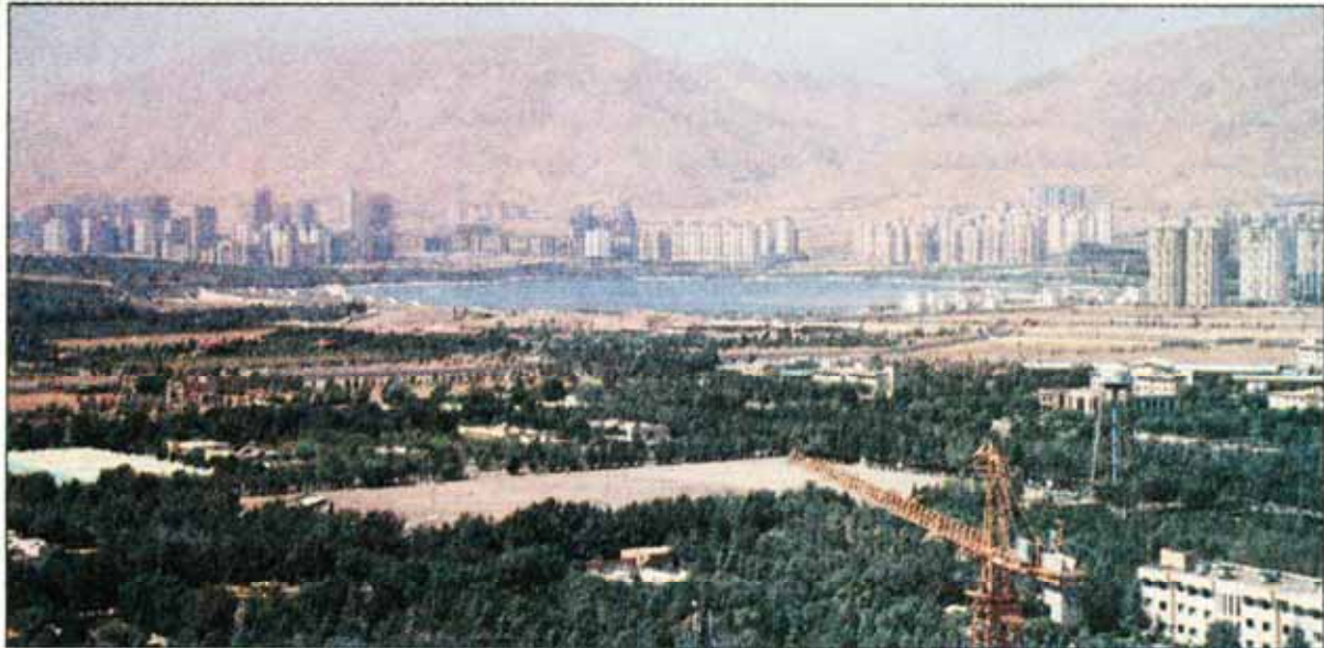
مطالعات جهانی نشان می دهد بلندمرتبه ها تأثیری روی افزایش آلودگی در وسعت زیاد ندارند.

ایتالیایی به نام Stefano Boeri Ar-chitetti در نظر دارد در شهر نانچینگ چین که دچار آلودگی شدید هواست، ۲ برج پوشیده از ۱۱۰۰ درخت و ۲۵۰۰ بوته گل ایجاد کند. این ۲ برج می توانند سالانه ۲۵ تن دی اکسید کربن جذب و روزانه ۶۰ کیلوگرم اکسیژن تولید کنند. قبلاً نیز شرکت مذکور ۲ برج مشابه دیگر با عنوان جنگل های عمودی در میلان طراحی کرده است. در ضمن پروژه مشابه دیگری در شهر لوزان سوئیس در حال اجراست و انتظار می رود اوایل سال ۲۰۱۸ افتتاح شود. یک شرکت معماری دانمارکی به نام 3XN نیز قصد دارد با ساخت ۲ برج چندمنظوره مسکونی پایدار به مبارزه با آلودگی هوا در بمبئی هند برود. این طرح «برج های درختی» نام دارد و بلندمرتبه ها در آن ظاهری شبیه درختان در هم تنیده دارند. پس از اجرای این طرح به لطف باغ های عمودی که اندازه شان قابل تغییر خواهد بود، کیفیت هوای محلی بهبود می یابد.