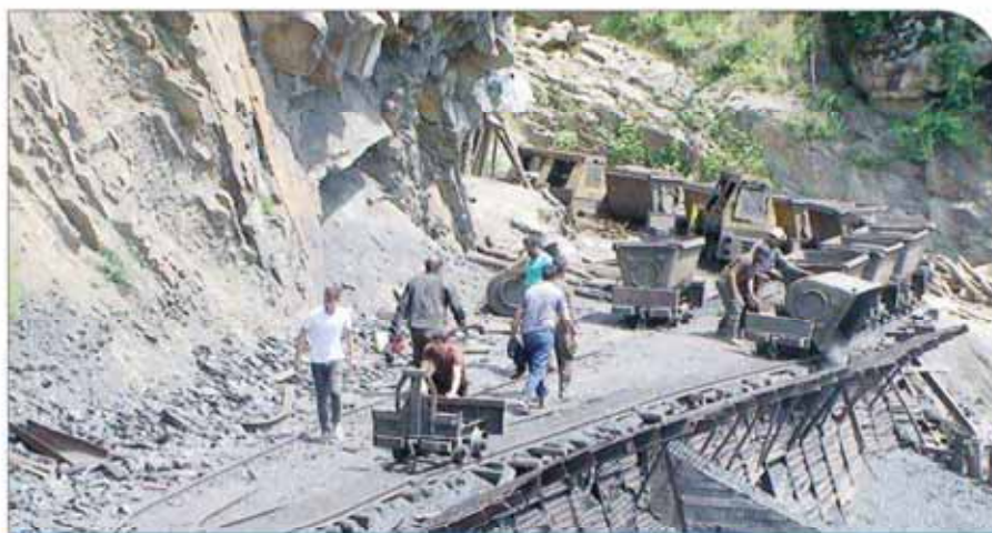
نگاره از صفحه قبل

زمانی که گزارش کامل از محل حادثه منتشر نشود نمی‌توان علت حادثه را مشخص کرد.