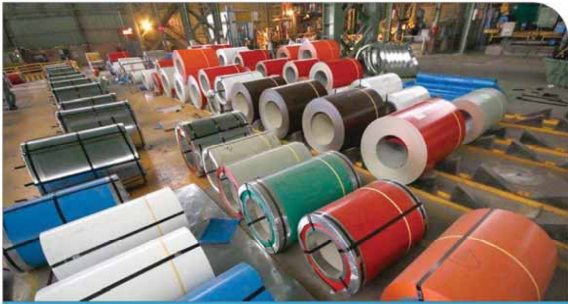
نگاره از صنایع معدنی