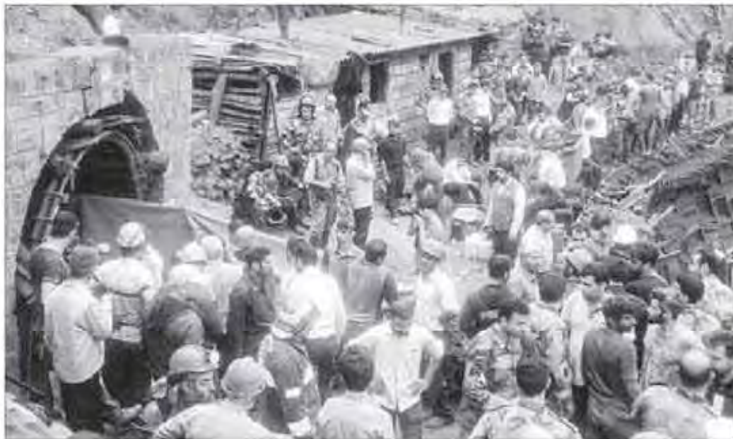
نگارنده: آرمینا محمدی