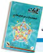
کسب و کار پویا با انجمن های آنلاین