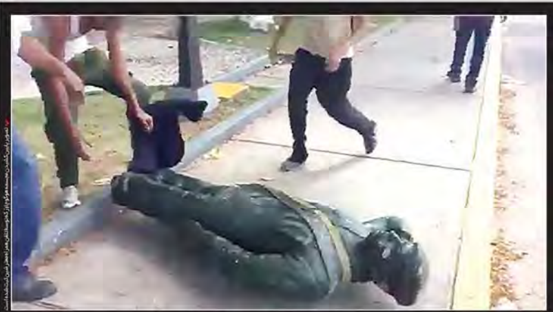
مردم ونزوئلا، مجسمه هوگو چاوز را پایین کشیدند

عضو هیات رئیسه مجلس: شورای نگهبان و دستگاه قضائی ورود کند - ستاد قالیباف: مقامات اجرایی و نظارتی نباید درباره بر نامه‌های کاندیداها نظر بدهند