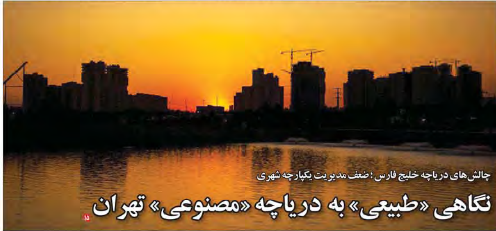
چالش‌های دریاچه خلیج فارس؛ ضعف مدیریت یکبارچه شهری

بر اساس گزارش سازمان نظامی تر سال‌های گذشته بیشترین ورودی‌های قاچاق به کشور از مرزهای دریایی جنوب است و استان هرمزگان به دلیل مرز آبی طولانی و یکی از منفذهای واردات کالا از مسیرهای اصلی قاچاق کالا بوده است حال در سال گذشته دولت بر