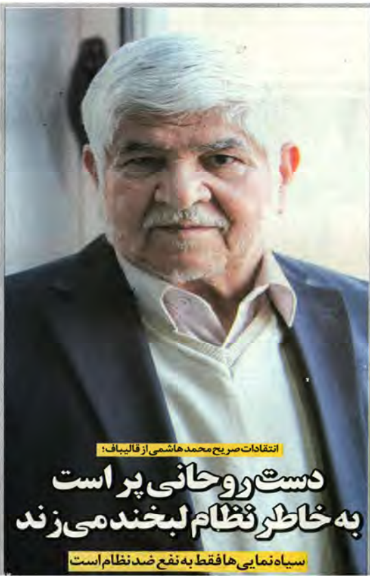
انتقادات صریح محمد هاشمی از قالیباف؛