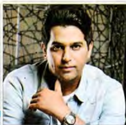
حمید عسکری، خواننده گفت و گویا